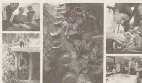
Exposició fotogràfica sobre Metges Sense Fronteres