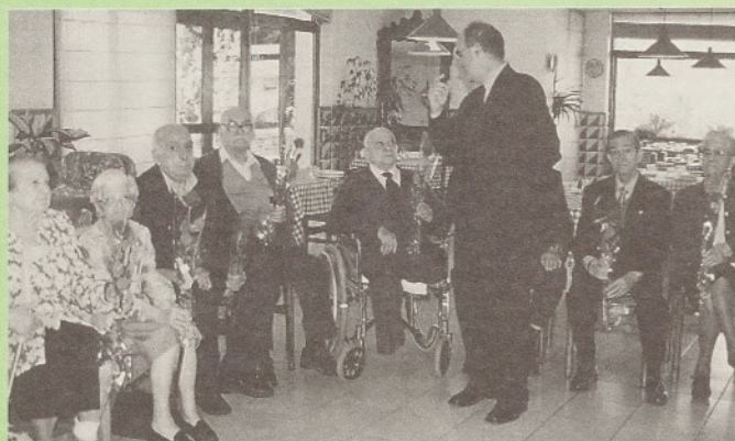
Instantània de l'alcalde regalant roses.