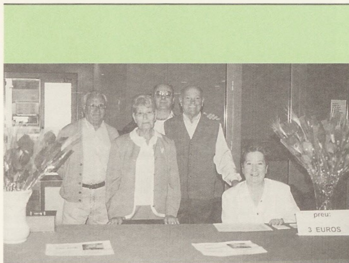
Companys ja jubilats, al front del punt de venda.