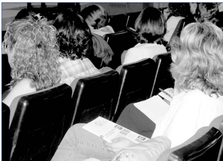
Un centenar de professionals van assistir a la I Jornada Cardiovascular

Un centenar de persones, entre metges d'atenció primària, metges especialistes en formació i infermeres, van participar el 27 de maig en la I Jornada Cardiovascular del Vallès Oriental, organitzada per la Unitat de Cardiologia