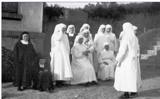
Una foto històrica de les germanes carmelites de l'Hospital