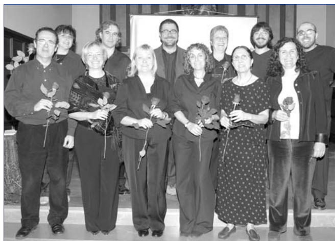
Companys i companyes de l'Hospital van participar en el recital de poemes