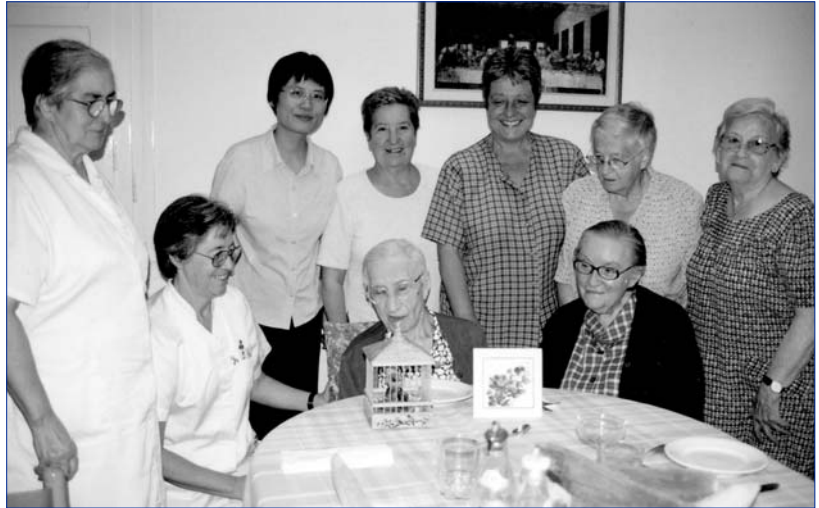
Les germanes de la congregació formen una gran família

Tot i el futur incert a Catalunya, la comunitat Vedruna és avui dia una de les congregacions amb més presència al món. En total, unes 2.400 germanes a tots els continents, excepte a Oceania, que no només desenvolupen tasques d'educació i sanitat, sinó d'altres com l'atenció a la marginació, camps de refugiats, l'educació social i de carrer, tallers de manualitats, cooperatives, treball a les presons i a associacions de voluntariat com Càrites i d'altres. "Estem presents als àmbits on hi ha problemàtiques socials. La Congregació és molt oberta i respecta per damunt de tot la persona i l'opció personal de cadascú. Segons les necessitats del moment, fem una tasca o una altra. El fonament de la vida religiosa és l'opció per Jesús i l'anunci del Regne, tot donant resposta a les necessitats que es van generant a cada moment històric. És un procés d'itinerància social". En aquest sentit, "les necessitats de l'Hospital han canviat molt. En el seu moment, ho vam donar tot per l'Hospital, però ara ja hi ha professionals i la nostra tasca ha d'encarar-se més cap al voluntariat". El fet de dedicar-se al treball voluntari té les seves gratificacions. "Podem anar sense pressa i això et permet establir una relació més profunda amb les persones. Pots arribar al seu cor i fugir de la superficialitat". A més, "reps molt dels malalts i dels familiars i aprens a viure des de l'essencial. La dimensió