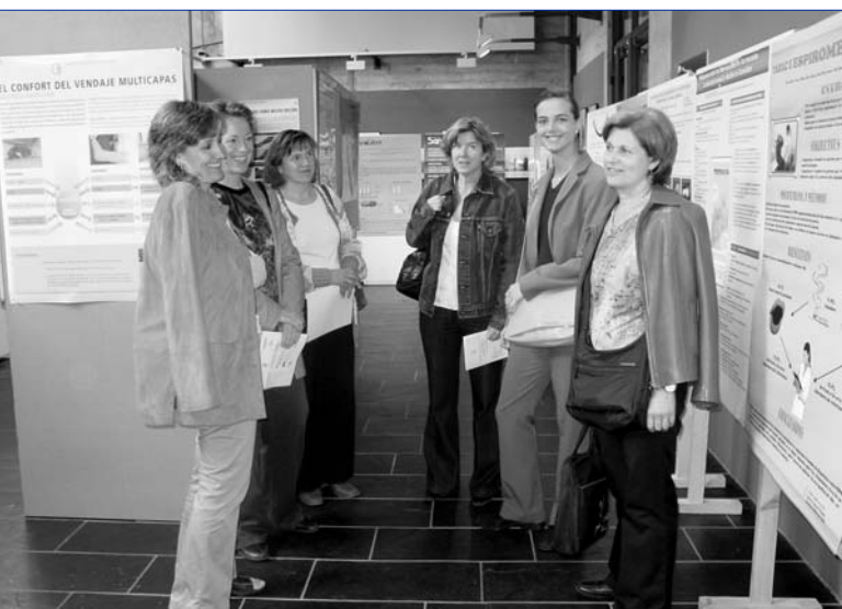
El Museu de Granollers va ser l'escenari de la Jornada d'Infermeria Creixem amb tu