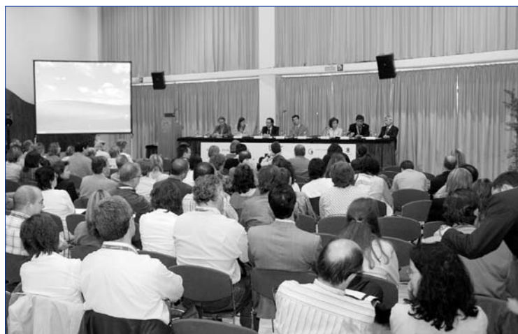
Destacats professionals van participar en les Jornades del Dolor

Les II Jornades de Dolor Crònic es van estructurar en dues taules rodones, una al matí sobre les patologies que originen el mal d'esquena i una altra a la tarda sobre els diversos tractaments existents per abordar aquest problema. Segons un estudi realitzat per la Universitat Autònoma de Barcelona, un 51% de la població catalana manifestava que patia i havia patit mal d'esquena. A més de les repercussions en la qualitat de vida de les persones afectades, el dolor també té conseqüències econòmiques importants. Un 34% de les