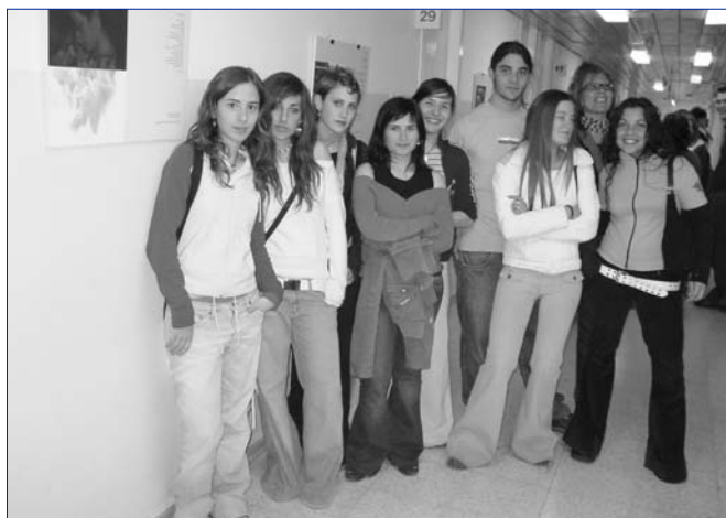
Alumnes del Celestí Bellera, autors de l'exposició de fotografies

I tu, com ho veus? és fruit de l'empenta de diverses persones de l'Hospital i de la il·lusió i el treball de professors i alumnes de l'IES Celestí Bellera de Granollers. Aquesta exposició forma part del projecte Hospitalart, emmarcat en l'Observatori de la Salut Dr. Carles Vallbona, que té com a objectiu establir lligams entre l'art i la salut, entre els artistes, els malalts i els professionals. Durant uns dies, les sales d'espera i els passadissos de l'Hospital es van convertir en un espai diferent