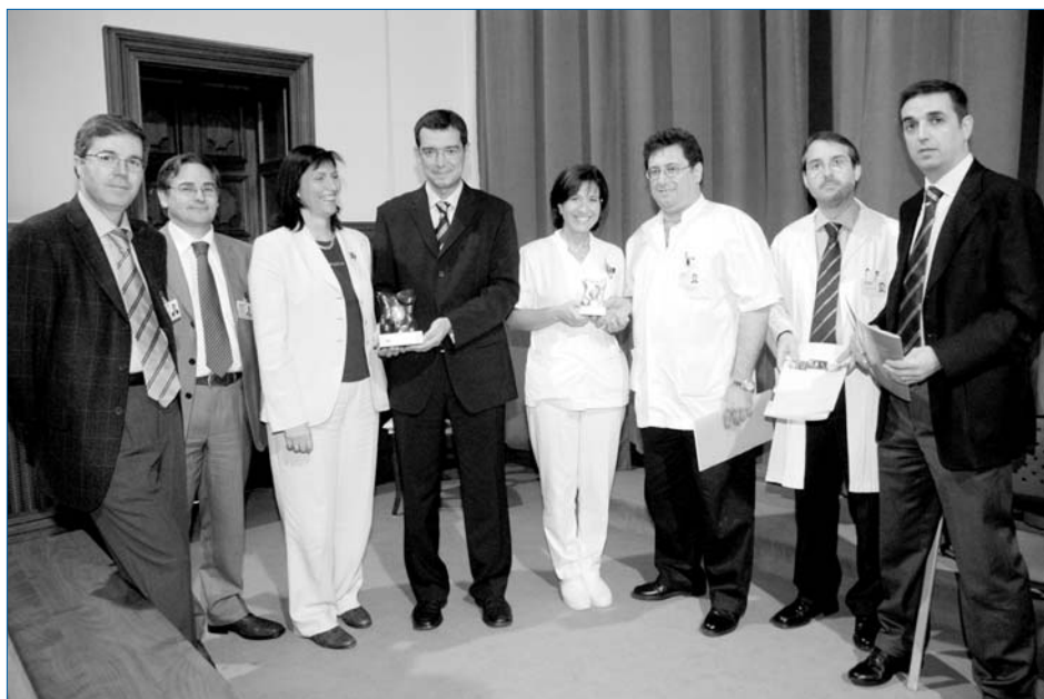
L'Hospital ha estat reconegut com el millor del grup de grans hospitals generals