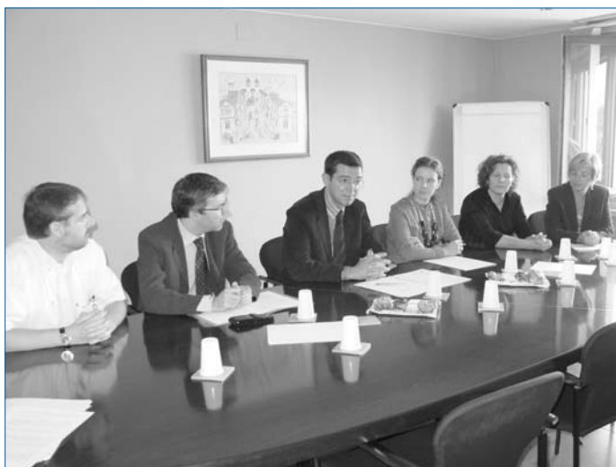
Representants de la FHAG i d'APADIS, en la signatura del conveni

LA FHAG ha signat un conveni de col·laboració amb la Fundació APADIS de les Franqueses del Vallès, amb el qual les dues institucions es comprometen a treballar per la promoció de l'accés al món laboral de persones amb discapacitat psíquica i física associada.