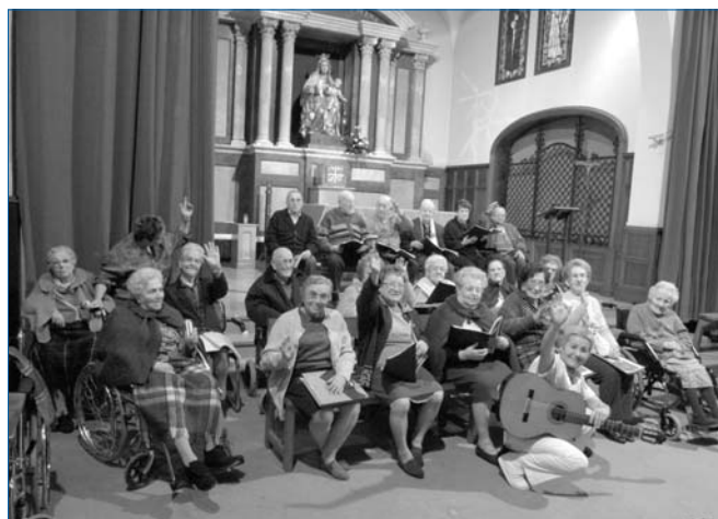
La Coral de l'Alegria en un moment de la gravació del disc