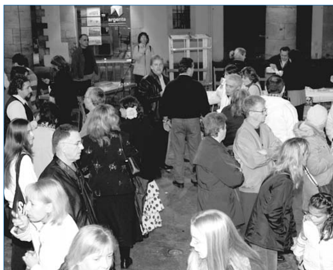
Diverses entitats van col·laborar animant la festa amb actuacions