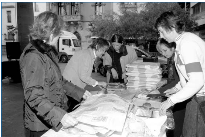
Durant la jornada es va repartir berenar i es van vendre manualitats