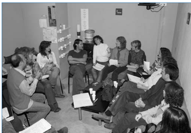
Alguns dels participants a l'acte, fent els últims preparatius per a la festa

Enguany, el Fem Festa s'ha afegit al projecte "Ajuda'ns a millorar el Geriàtric", iniciat el Nadal 2004 amb la campanya de Gran Centre Granollers, per a l'adquisició dels nous llits per a les àrees assistencials del Centre Geriàtric, la Unitat de Convalescència i la Unitat de Cures Pal·liatives, iniciativa que cal recordar va ser l'origen de l'actual OSVA.