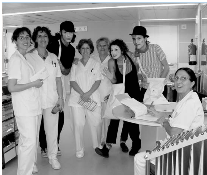
Un grup de mims van repartir informació a tots els serveis i les unitats del centre