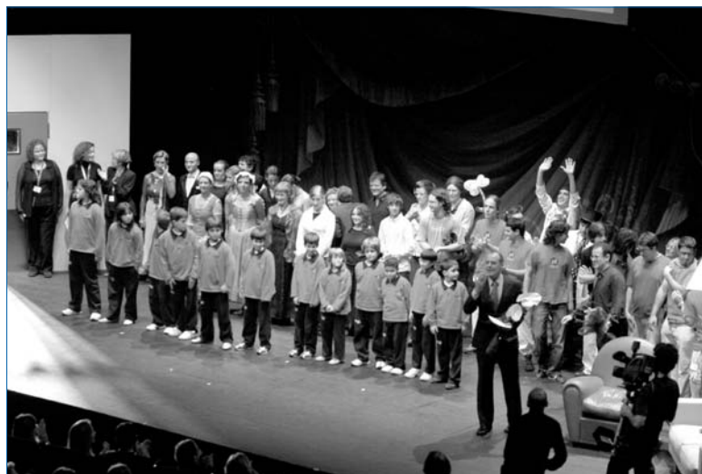
Amb la col·laboració de tothom, es va aconseguir que el Fem festa fos un èxit