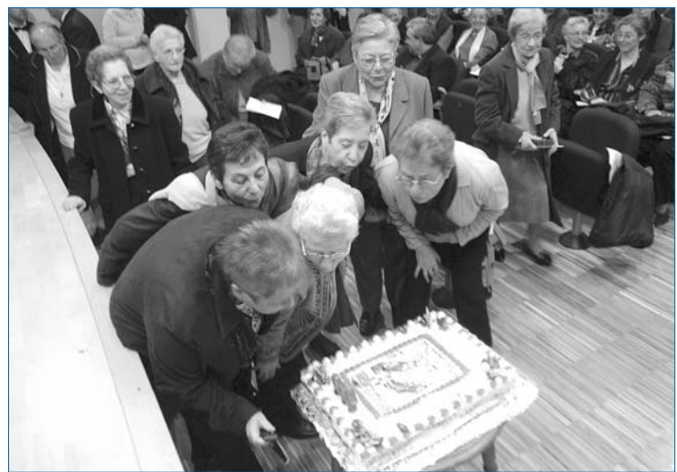
Les germanes van bufar les espelmes del pastís commemoratiu