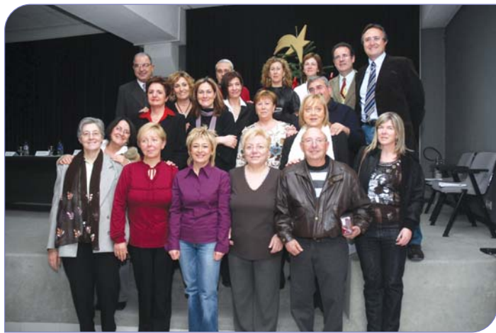
Professionals del centre que durant el 2007 han fet 25 anys o bé s'han jubilat