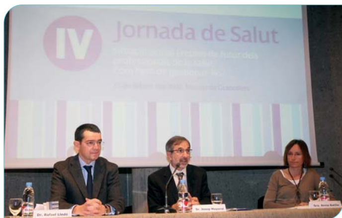
La Jornada es va centrar en els aspectes que afecten els professionals de la salut