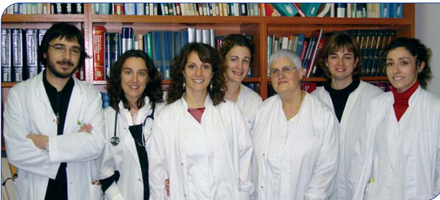
Nou equip d'atenció hospitalària a domicili

Una de les alternatives punteres de l'hospitalització convencional són els equips d'atenció hospitalària a domicili. Aquestes alternatives permeten atendre el pacient de forma ambulatoria o bé ingressar els pacients a domicili. L'Hospital General de Granollers ha posat en marxa enguany un segon equip assistencial que ofereix aquest tipus de servei. Existeixen, en concret, tres models alternatius a l'hospitalització convencional: la Unitat de Diagnòstic Ràpid (UDR), dirigit a pacients amb símptomes de patologia greu, que requereixen ingrés hospitalari però que el seu estat general permet fer l'estudi de forma ambulatoria i sense demores; l'Hospitalització a Domicili (HaDom), orientada als pacients amb criteri d'ingrés hospitalari però que es desenvolupa al domicili del pacient; i l'Hospital de Dia Medicoquirúrgic (HDMQ), dirigida a pacients valorats des de diverses àrees hospitalàries o d'atenció primària per fer seguiments mèdics, tractaments o procediments assumibles a un Hospital de Dia.