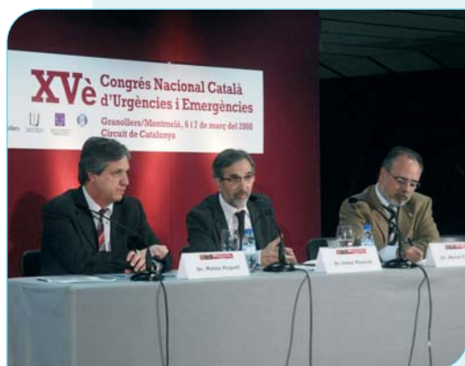
Acte inaugural del XVè Congrés Nacional Català d'Urgències i Emergències

Durant els dies 6 i 7 de març, Granollers es va convertir en la capital de la sanitat catalana. I és que, més de 300 especialistes de la salut es van reunir al Circuit de Catalunya per assistir al XVè Congrés Nacional d'Urgències organitzat, per primera vegada, per l'Hospital General de Gra-