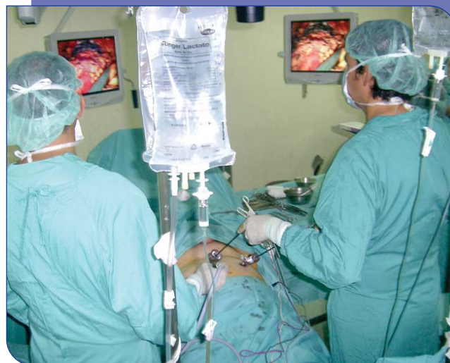
La laparoscòpia és una tècnica quirúrgica menys agressiva

2006 la cirurgia laparoscòpica de l'adenoma de pròstata i durant el 2007 la de la cistectomia total per càncer de bufeta urinària.