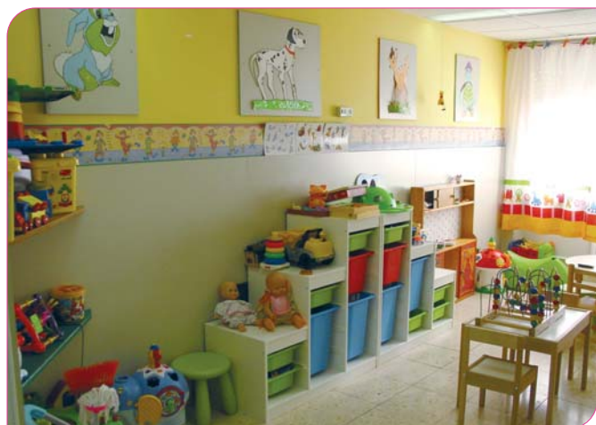
Sala de Jocs de Pediatria després de la reforma