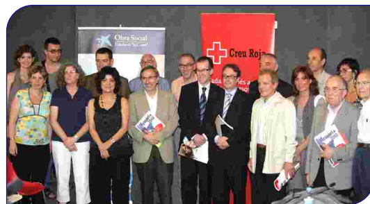
Representants de les dues entitats i de la Fundació "la Caixa"