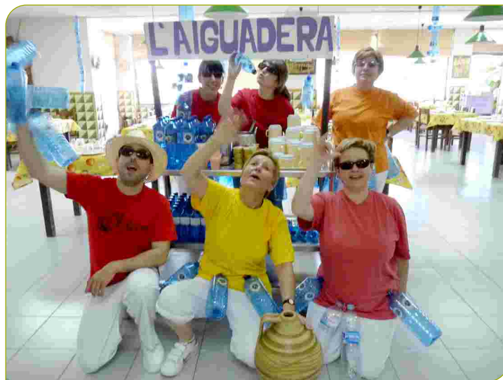
Un moment de la Festa de l'Aigua que es va organitzar a la residència

A les persones més dependents es personalitza quan es realitzen els canvis posturals.