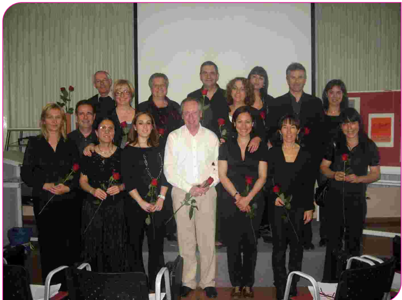
La poesia i la música van estar-hi presents un cop més gràcies a diversos treballadors de l'Hospital

En aquest dia tan especial també es van vendre roses en benefici de la Residència de la gent gran del Centre Geriàtric Adolfo Montañá i es van repartir punts de llibre commemoratius a tots els malalts ingressats i als professionals del centre.