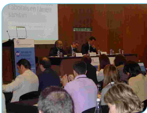
Un moment de la inauguració de la Jornada

Prevenir situacions d'emergència com incendis i estudiar els plans d'autoprotecció que actualment s'estan duent a terme als centres sanitaris catalans són alguns dels aspectes que es van debatre el 20 de maig passat a l'Hotel Ciutat de Granollers dins el programa de la XV Jornada de Prevenció de Riscos