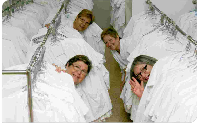
Professionals de Llenceria