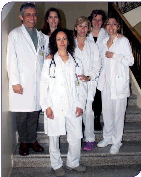
Els professionals del Servei de Medicina Interna que van rebre el premi