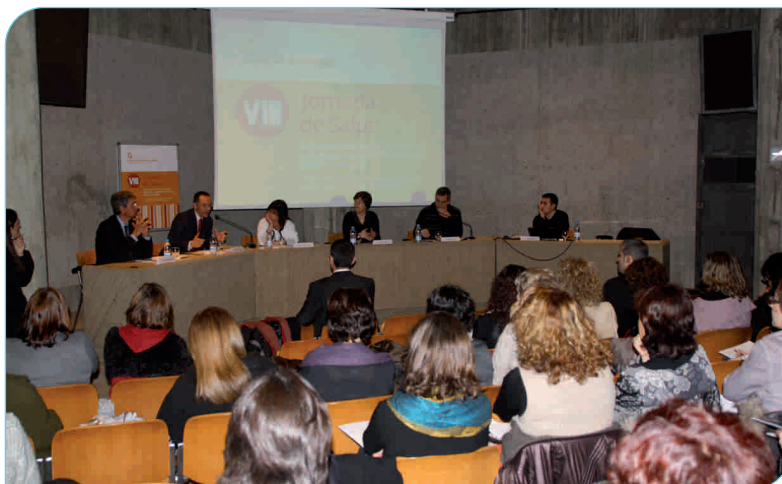
La 8a edició de la Jornada de Salut, que va tenir lloc a la sala d'actes del Museu de Granollers, va tenir força públic