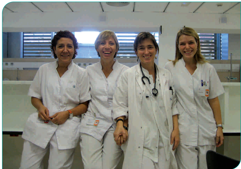
Algunes de les membres de l'equip de professionals que treballen a l'Hospital de Dia Mèdic de l'HGG

vasculars, neurològiques, digestives, reumatològiques, pneumològiques i, fins i tot, pediàtriques, fet que comporta que siguin molts els professionals que directament o indirecta estan implicats en el servei. Aquests realitzen una tasca multidisciplinària amb un gran treball en equip. El futur del servei està a seguir donant suport al pacient en l'àmbit ambulatori, obrint noves línies i ampliant els lligams amb l'atenció primària i l'atenció especialitzada.