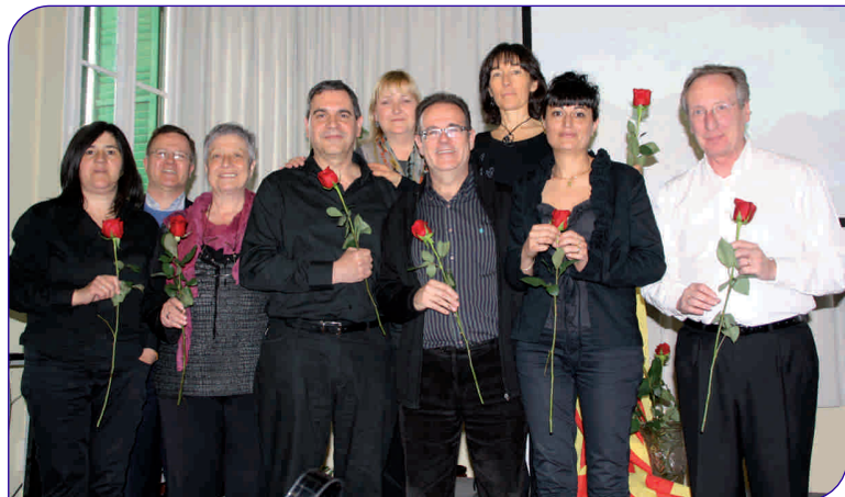
Diversos treballadors de l'Hospital van fer, com ja és tradicional, una lectura de poemes

Com cada any els treballadors de l'Hospital General de Granollers van organitzar diverses activitats per commemorar la diada de Sant Jordi. Aquest any, com a novetat, es va engegar la I Marató de donació de sang dirigida a tots els professionals de la institució. Totes les persones que van ser donants van rebre un llibre i una rosa, cortesia de Vivers Ernest. Per altra banda, també es va celebrar el tradicional recital poeticomusical, una activitat cultural on alguns professionals fan una lectura de poemes amb l'acompanyament d'un músic.