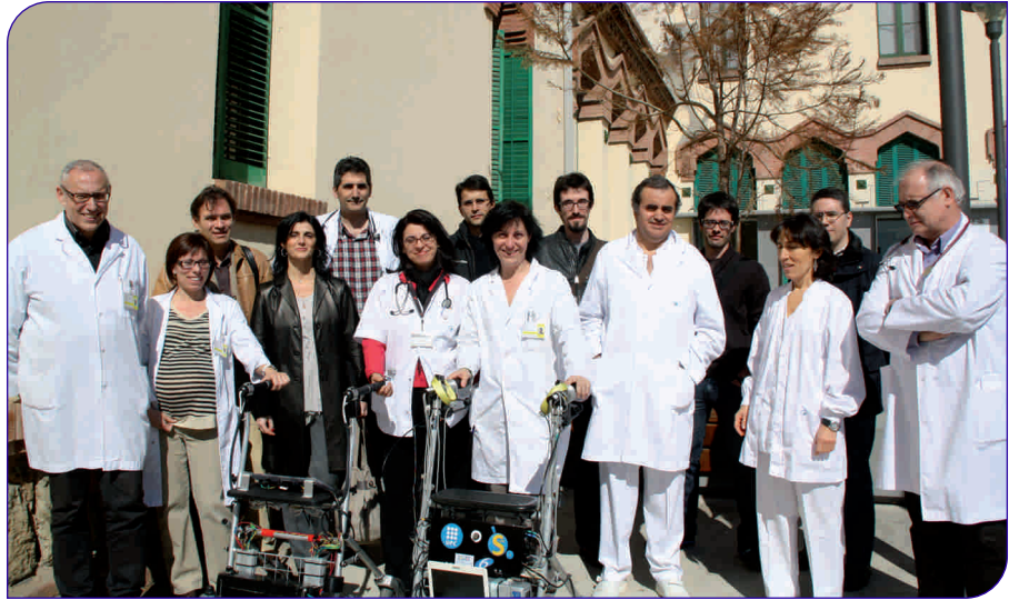
Fotografia del grup de professionals de l'Hospital que participen en el projecte europeu "I-DONT-FALL"