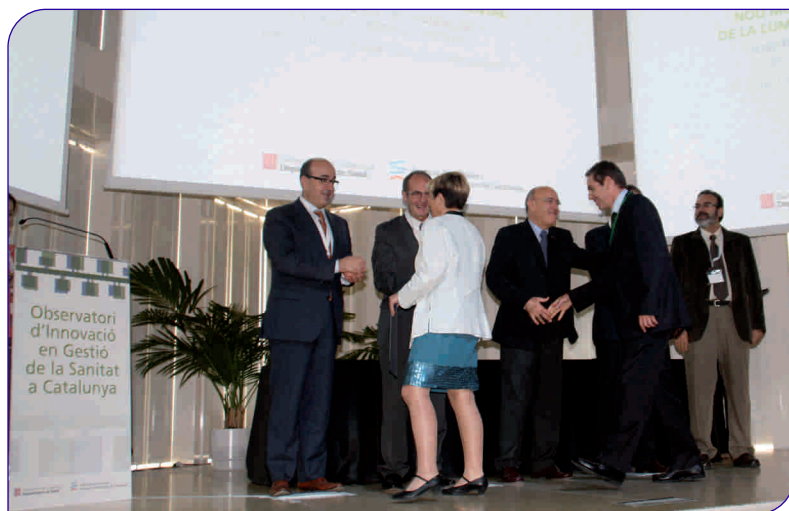
Els representants de l'Hospital General de Granollers van rebre els premis en presència del conseller Boi Ruiz

En el marc de la II Jornada de l'Observatori d'Innovació en Gestió de la Sanitat a Catalunya (OIGS), celebrada el mes d'octubre a Barcelona, el Nou model d'atenció integral de la Lumbàlgia al Vallès Oriental i el Programa d'atenció al pacient pluripatològic a medicina interna de la Fundació Privada Hospital Asil de Granollers van rebre, com a millors experiències, el certificat de qualitat del procés d'avaluació expedit per l'Agència de Qualitat i Avaluació Sanitàries de Catalunya (AQuAS) a mans del conseller de Salut, Boi Ruiz.