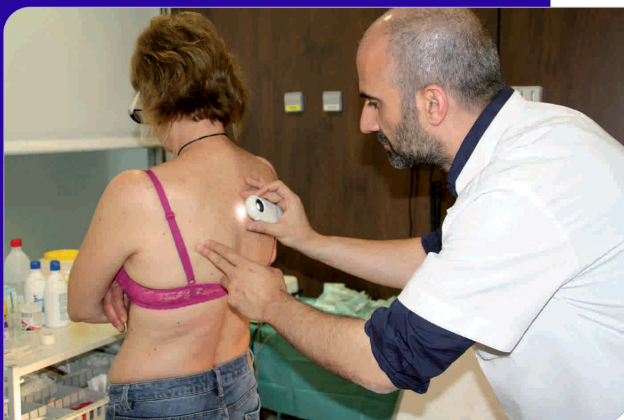
La Unitat de Dermatologia de l'HGG es consolida com a referent de l'especialitat al Vallès Oriental

La Unitat de Fototeràpia permet el tractament de pacients amb psoriasi greu i altres patologies immunomediades. Aquesta consisteix en l'aplicació terapèutica de determinats rangs de freqüències de la llum ultraviolada mitjançant cabines i panells. El control digital de lesions pigmentades és un sistema d'imatge assistit per ordinador que permet el diagnòstic més precoç del melanoma i el seguiment de pacients amb més risc. Per altra banda, l'ecografia cutània d'alta resolució és una tècnica d'imatge novedosa en el camp