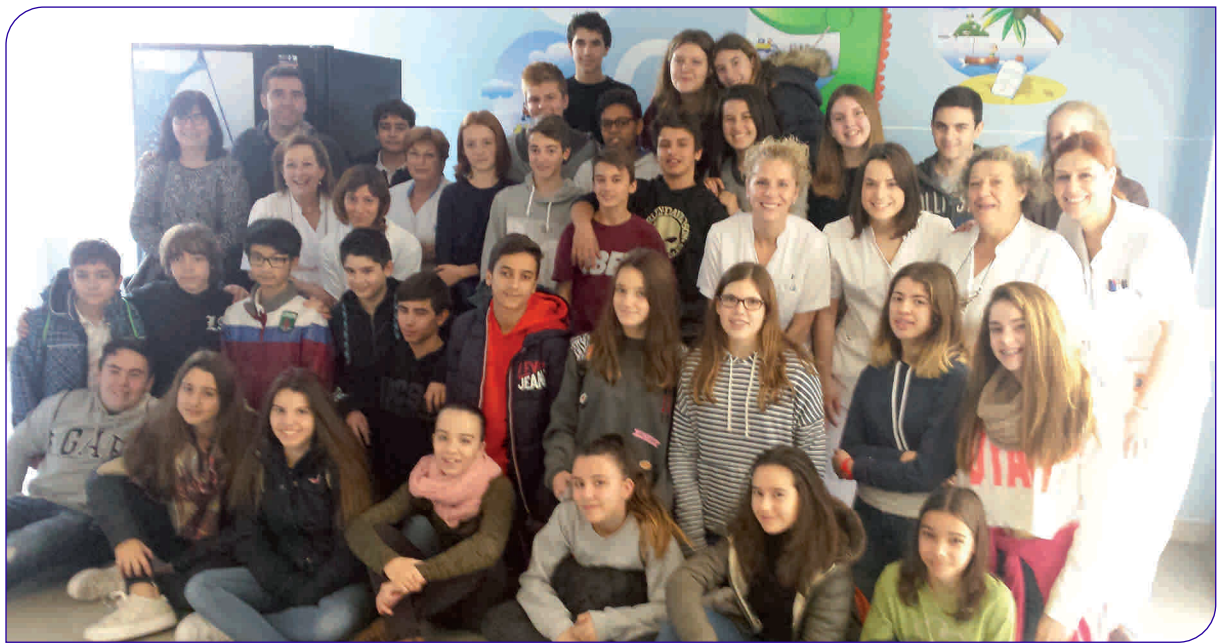
Alumnes de 2n d'ESO de l'Escola Cervetó