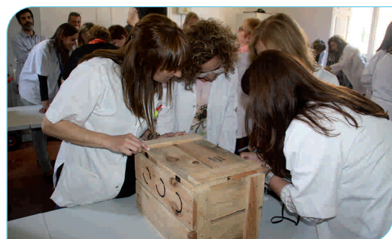
L'itinerari formatiu per als administratius de l'Hospital va començar el 18 d'abril