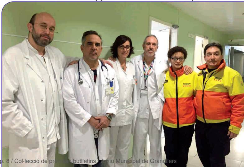
L'equip coordinador de donació de teixits de l'Hospital General de Granollers

Per dur a terme tota aquesta tasca la Fundació Privada Hospital Asil de Granollers col·labora activament amb l'Organització Catalana de Trasplantaments (OCATT).