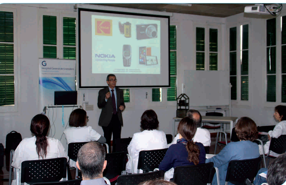
Un moment de la jornada, que va tenir lloc a les instal·lacions de l'Hospital el 20 de novembre passat

El 20 de novembre de l'any passat l'Hospital va celebrar per tercer any consecutiu la Jornada de Recerca i Innovació amb l'objectiu d'estimular i potenciar la recerca biomèdica i traslacional del centre, així com fer participants els assistents de totes les accions que s'estan desenvolupant actualment sobre aquest camp.