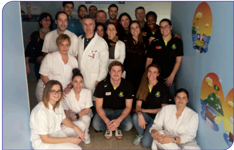
Jugadors i jugadores dels equips de Divisió d'Honor del Fraikin BM Granollers

I per segon any consecutiu, una representació d'alumnes de 2n d'ESO de l'Escola Cervetó van decorar la planta amb diferents motius nadalencs que van estar realitzant a classe per tal que nens, famílies i professionals poguessin viure un ambient més nadalenc i transmetre la seva il·lusió.