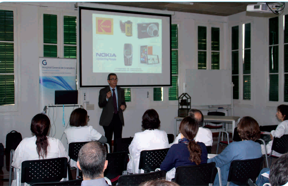
Un moment de la jornada, que va tenir lloc a les instal·lacions de l'Hospital el 20 de novembre passat

El 20 de novembre de l'any passat l'Hospital va celebrar per tercer any consecutiu la Jornada de Recerca i Innovació amb l'objectiu d'estimular i potenciar la recerca biomèdica i traslacional del centre, així com fer participants els assistents de totes les accions que s'estan desenvolupant actualment sobre aquest camp.