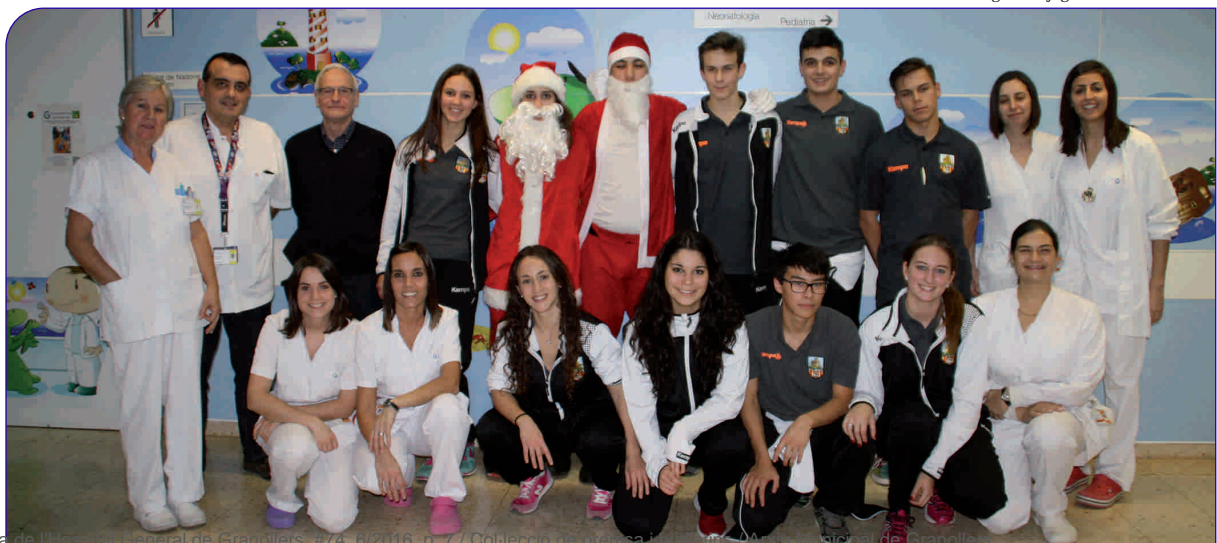
Jugadors i jugadores del BM La Roca