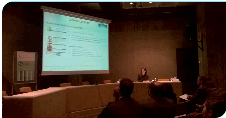
Un moment de la 12a edició de la Jornada de Salut, que va tenir lloc a la sala d'actes del Museu de Granollers

En acabar es va fer un debat enriquidor sobre aquesta temàtica tan vigent actualment i d'importància cabdal des del punt de vista socio-econòmic, i que permet fer arribar el coneixement clínic al mercat.