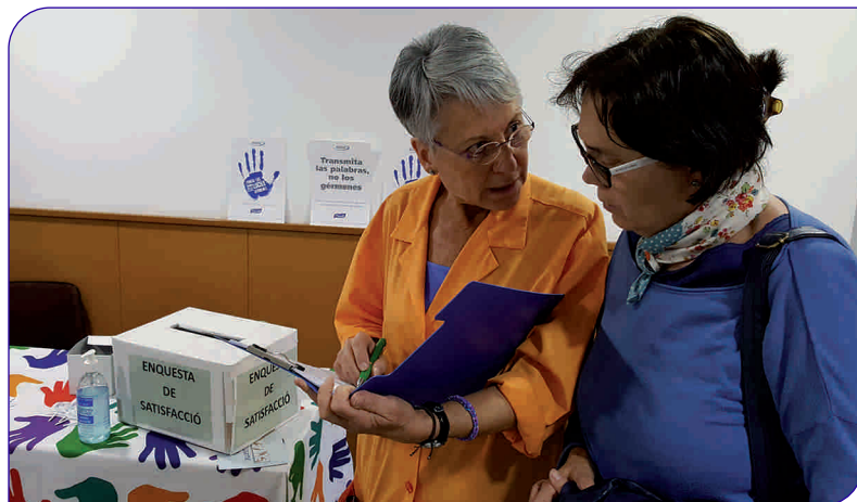
Voluntaris per l'Hospital van repartir informació a professionals i usuaris a les entrades principals del complex

El 5 de maig l'Hospital General de Granollers va participar un any més en la campanya impulsada per l'Organització Mundial de la Salut (OMS), amb l'objectiu de promoure la higiene de mans en els centres hospitalaris.