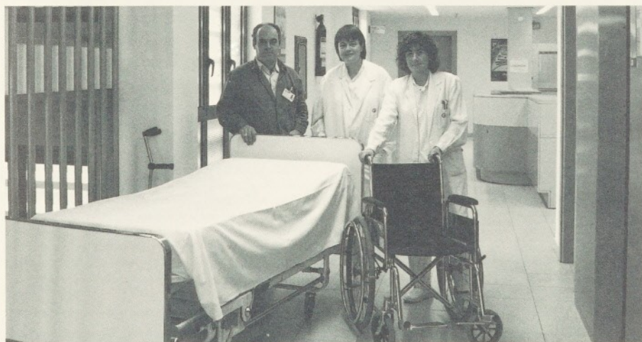
La demanda d'aparells ortopèdics s'ha vist incrementada en aquests últims anys.

El Banc de Préstec d'Aparells Ortopèdics es va crear a l'Hospital l'any 1990 amb l'objectiu d'aprofitar tot el material en desús que el nostre centre genera i oferir-lo a totes les persones que passen dificultats econòmiques.