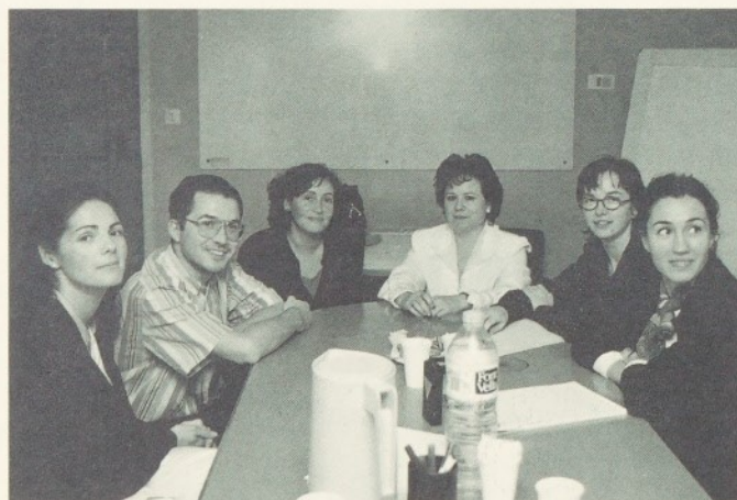
"La nit es converteix en tot un servei"

MM: Fa un temps vam dur a terme un estudi per tal de conèixer les causes per les quals molts malalts es queixaven, a través de les enquestes a l'usuari, de tenir problemes per