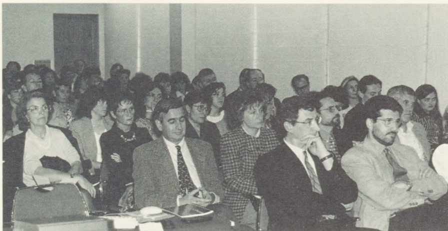
Les jornades van comptar amb una nombrosa participació de professionals de la comarca.

La participació a les Jornades va ser nombrosa, amb l'assistència de 139 professionals de la comarca que van participar activament a les taules rodones i als tallers. En total es van presentar 13 comunicacions. La dieta va ser, una vegada més, protagonista de les Jornades com a element fonamental per a la salut. En aquesta ocasió es va presentar el programa informàtic DIGERC per a l'elaboració de dietes car-