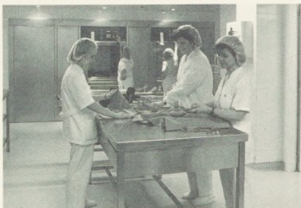
La Central d'Esterilització s'ha convertit en un centre de referència per a les altres centrals.

Ens han visitat molts professionals que, en alguns casos, procedien de països tan llunyans com ara Finlàndia o Corea. Seguint aquesta dinàmica, recentment han estat deu