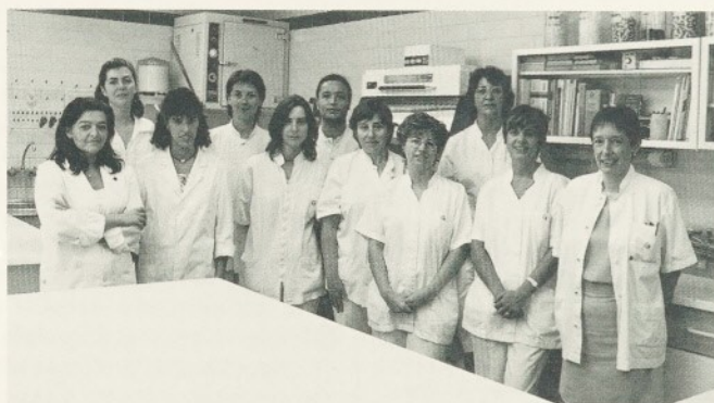
L'equip del Servei de Farmàcia.

- És servei liderar la Comissió de Farmàcia i Terapèutica, disposar de Guia Farmacolò-