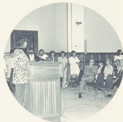
La presentació del "de Bat a Bat" va despertar l'interès dels nostres professionals.