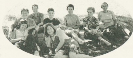
Les germanes durant l'estada a Taizé

Taizé, una comunitat que, mitjançant germans i joves enviats, és a prop dels qui es troben immobilitzats en l'interior de les seves fronteres.