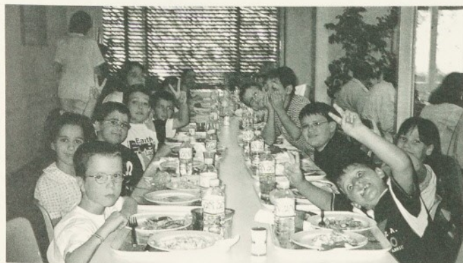
Els nens i nenes dinaven cada dia al menjador del personal de l'Hospital.