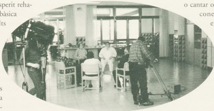
Moment del rodatge d'un grup de pacients