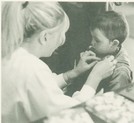
Els llaços vermells, protagonistes d'aquesta diada

Les principals qüestions que es van tractar en el decurs de la taula rodona van ser les relacionades amb la punxada accidental (risc de contagi, mesures de protecció, etc.),