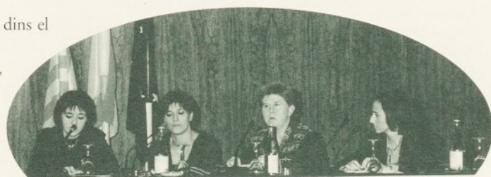
Jornades de Cirurgia i VII Jornades d'Infermeria de Cirurgia 17 de desembre