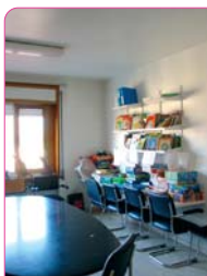
Antiga Sala de Jocs

Fruit de l'esforç i la solidaritat del cos de Mossos d'Esquadra de Granollers i del Club Esportiu Trencacames, format per membres de la Policia Local i Bombers de Granollers, avui els nens de la planta de pediatria de l'Hospital de Granollers gaudeixen de nou mobiliari, material infantil i joguines.