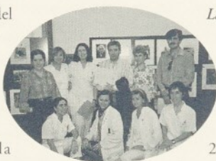
La Sala d'Actes en el moment del lliurament de premis.

El tema del certamen era "El vell i el seu entorn" i van participar-hi 17 persones, amb un total de 44 fotografies, que van estar exposa-