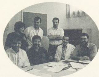
L'equip mèdic de l'UCI:

Pel que fa a la informació, és confidencial i només es facilitarà als familiars més directes, i, per tant, no se'n donarà per via telefònica. Habitualment, cada dia un metge del Servei, entre les 13.30h i les 14.30h, informarà de l'estat del pacient als familiars que ho desitgen. Això no obstant, sempre que