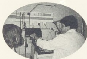
Personal mèdic i d'infermeria ultimant la posta a punt del material de l'UCI.

L'UCI de l'HGG, situada a la primera planta de l'edifici nou, és un servei ●●● (Continua a la p. 3)