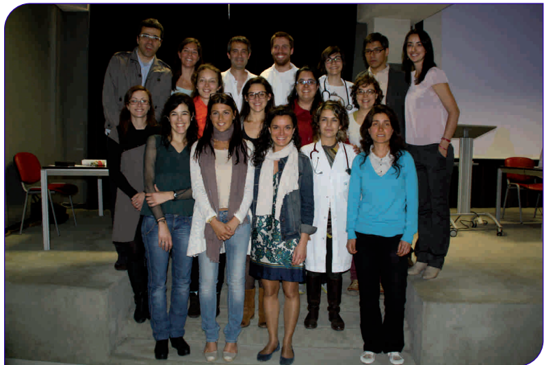
Alguns dels vint-i-quatre especialistes en formació que han acabat la seva estada a l'Hospital General de Granollers