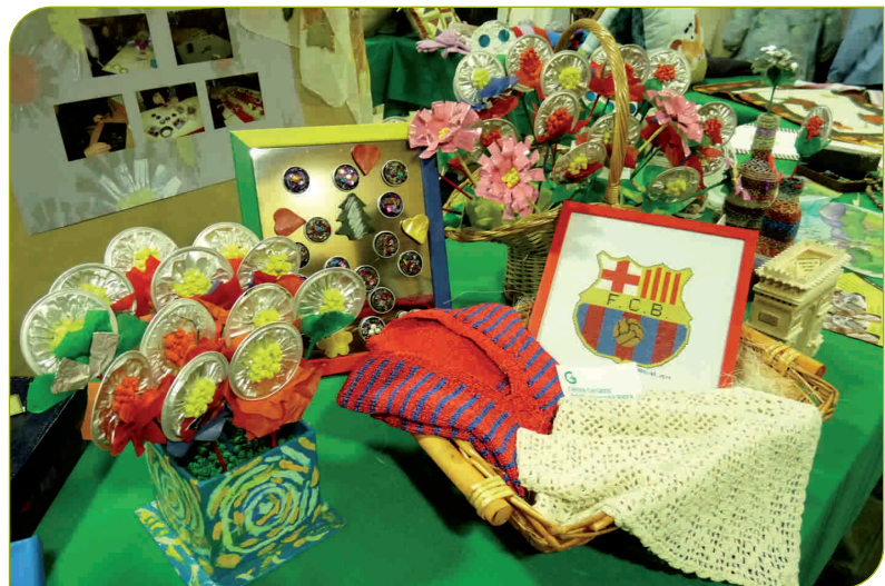
Algunes de les manualitats que es van exposar a la Sala Tarafa de Granollers

Durant les Jornades es va gaudir de l'exposició de treballs manuals realitzats pels ciutadans de Granollers a la Sala Tarafa fruit dels diversos tallers que es porten a terme a la ciutat. La participació de la Residència va ser nombrosa, amb mostres manuals de 22 residents; l'Hospital de Dia geriàtric va aportar-hi manualitats de 6 usuaris i l'Hospital de Dia Sant