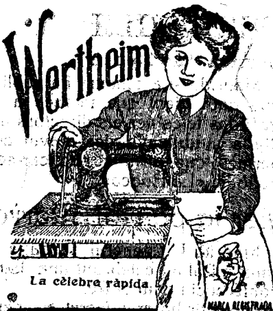
La cèlebre ràpida.

La de millor resultat - Ensenyança de brodar gratuïta. - Reparacions Venda d'accessoris Sucursal a GRANOLLERS: Corró, 42