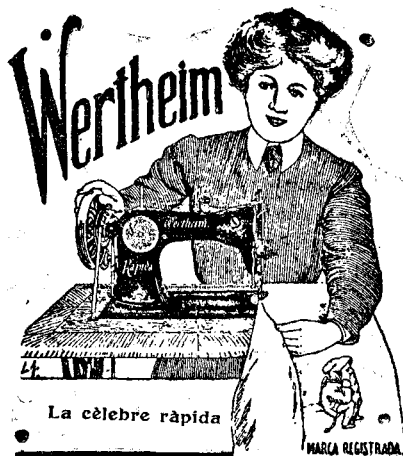
La cèlebre ràpida