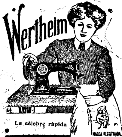
La cèlebre ràpida