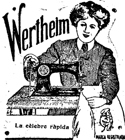
La cèlebre ràpida