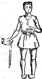
Plés varas ó zepes los miembros, se curan fácilmente en pocas semanas y sin sufrimiento alguno.