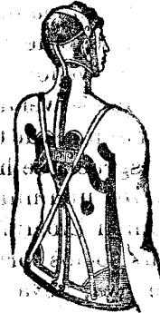
Corse-Minerva para la curacion del torticolis.