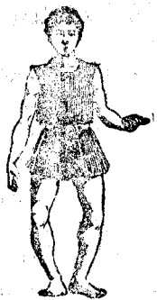
Desviación externa de las piernas, es corregible en sus diversos grados.

Tiene á disposición del que lo solicite habitaciones. VERDADERAMENTE RESERVADAS.—PRECIO ECONOMICO.—ROND. DE LA UNIVERSIDAD, 7, 2.º.—RECIBE DE 3 A 5.—BARCELONA.