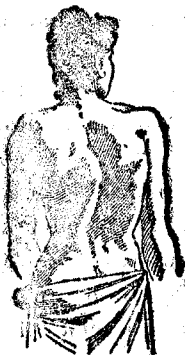
Desviación de la columna vertebral (a) tercer grado; antes de curarse.