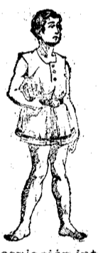
Desviación interna de las piernas, es corregible en sus diversos grados.

CALLE DE LA UNIÓN, 17, Entresuelo, 1.º BARCELONA