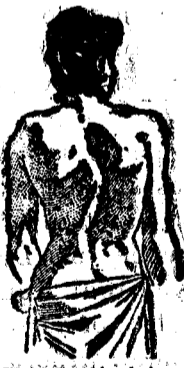
Desviación de la columna vertebral á tercer grado; antes de curarse.