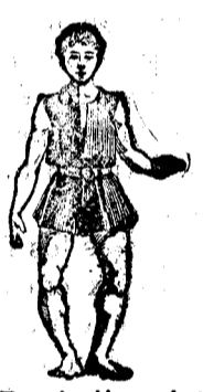
Desviación externa de las piernas, es corregible en sus diversos grados.