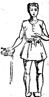
Piés varus ó zopos congénitos, se curan radicalmente en pocas semanas y sin sufrimiento alguno.