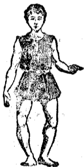
Desviación externa de las piernas, es corregible en sus diversos grados.

Tiene a disposición del que lo solicite habitaciones. VERDADERAMENTE RESERVADAS.—PRECIO ECONOMICO.—RONDA DE LA UNIVERSIDAD, 7, 2.º.—RECIBES DE 3 A 5.—BARCELONA.