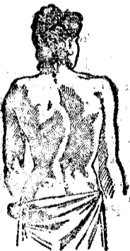
Desviación de la columna vertebral (a) tercer grado; antes de curarse.