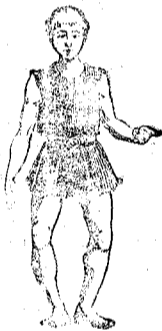
Desviación exterior de las piernas, es corregible en sus diversos grados.

Tiene á disposición del que lo solicite habitaciones. VERDADERAMENTE RESERVADAS.—PRECIO ECONÓMICO.—RONDA DE LA UNIVERSIDAD, 7, 2.º.—REGISTRO DE 3 A 5.—BARCELONA.