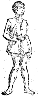
Desviación interna de las piernas, es corregible en sus diversos grados.

CALLE DE LA UNIÓN, 17, Entresuelo, 1.ª BARCELONA