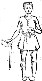
Plés varas ó zopos con entos, se curan radicalmente en pocas semanas y sin sufrimiento alguno.