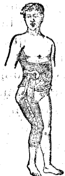
Coxalgias ó luxaciones, ya sean esponjóneas, ya reumáticas, escrofuláceas ó traumáticas, se corrigen radicalmente.