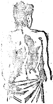
Desviación de la columna vertebral (a) tercer grado; antes de curarse.