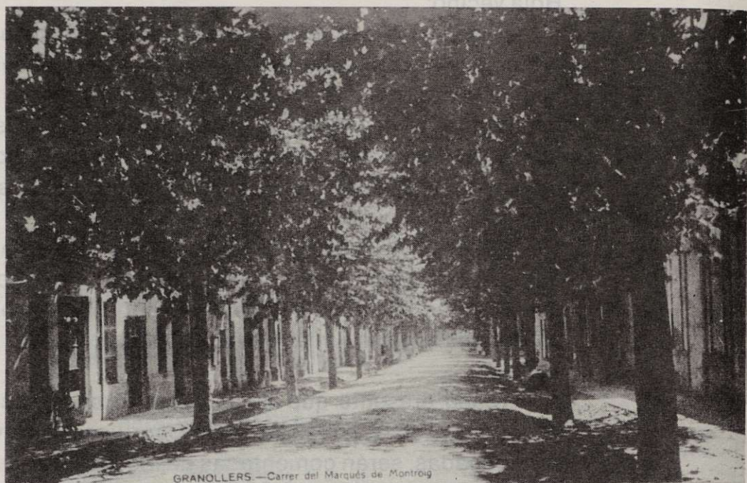
GRANOLLERS.—Carrer del Marquès de Monroig