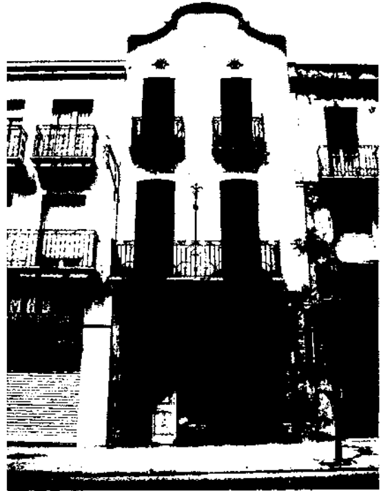
La Bombonera. Rospil. 1910-11. La Garriga.