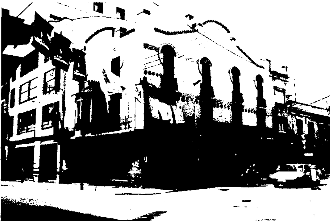
Casa de Miquel Blaxter. Jeroni Martorell. 1904. Granollers. L'arquitecte modernista agafa com element característic del gòtic com l'arc apuntat, l'estrella, en treu l'essència i el reinventa, li dona vida i el pot convertir en un arc parabòlic de línies molt dolces.

A Granollers el creixement urbà va venir marcat per la construcció de la carretera Barcelona-Vic-Ribes l'any 1848 que va esdevenir el nou eix vial de la ciutat, just per sota de l'antic nucli urbà, eix que es veié reforçat per l'arribada de la primera línia de ferrocarril el 1854, línia que corria paral·lela a la carretera, pel que ara és el carrer de Girona. Aquestes noves vies de comunicació foren factors determinants per al creixement de la ciutat i van marcar la nova disposició urbanística de Granollers, que creixeria de forma allargada entre aquests dos eixos viaris. D'aquesta manera fou, sobretot, al llarg de la carretera que es va desenvolupar la més important activitat constructora, i les noves cases es van bastir sota la inspiració dels models constructius que es feien a Barcelona. Cases segons patrons eclèctics, modernistes i noucentistes.