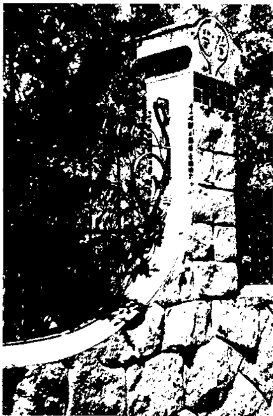
Reixó de casa Barbey. Raspall. La Garriga.

El Modernisme parteix de la idea de la integració de les arts, que dona igual importància a les arts industrials i decoratives que a la mateixa arquitectura.