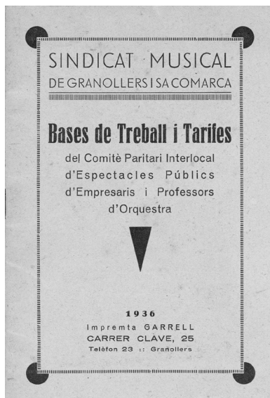
Document de Bases de Treball i Tarifes del Comitè Paritari Interlocal d'Espectacles Públics d'Empresaris i Professors d'Orquestra, editat per la Impremta Garrell en 1936.

Ponències Revista del Centre d'Estudis de Granollers, 27 (2023), 7-43