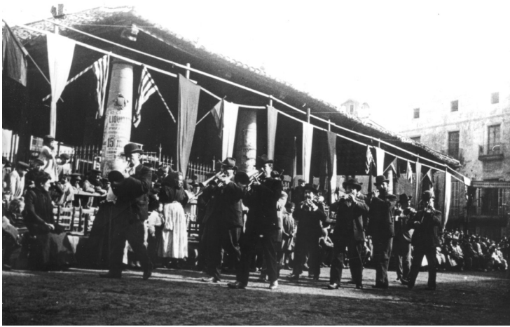
L'orquestra Els Agustins desfilant per la plaça de la Porxada durant un acte festiu.

Ponències Revista del Centre d'Estudis de Granollers, 27 (2023), 7-43