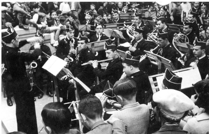
Primer concert efectuat per la Banda de Granollers, al Parc de l'Estació. Fotografia: autor desconegut, 18/10/1936, AMGr.

Les imatges més conegudes d'aquesta època són les de la Banda de les Milícies, que es formà a partir de l'orquestra de l'SMGC. El seu director era el mestre Ruera, i els integrants eren músics que no havien pogut anar al front, per edat o per malaltia.