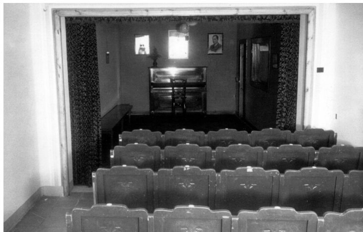
Sala d'audicions de l'edifici de Falange, confiscat a La Unió Liberal, al carrer Josep Anselm Clavé. En primer terme, quatre files de butaques de fusta; al fons, un espai amb un piano i un retrat de José Antonio Primo de Rivera. Fotografia: autor desconegut, 1950, AMGr.

A partir d'aquest moment, es reprèn l'activitat, enviant una carta de la nova «Entidad Mutual» als representants de tots els conjunts musicals, convocant-los a una reunió «para tratar del gravamen del 1 por 100 de los contratos impuestos al contratante y con destino a dicha Caja», 108 esperant recuperar una forma bàsica d'ingressos —l'1% dels contractes— per a tornar a ampliar la caixa de pensions del sindicat. Ara, però, sotmesa a la Delegación sindical local de Granollers de la Falange Española Tradicionalista y de las J.O.N.S.