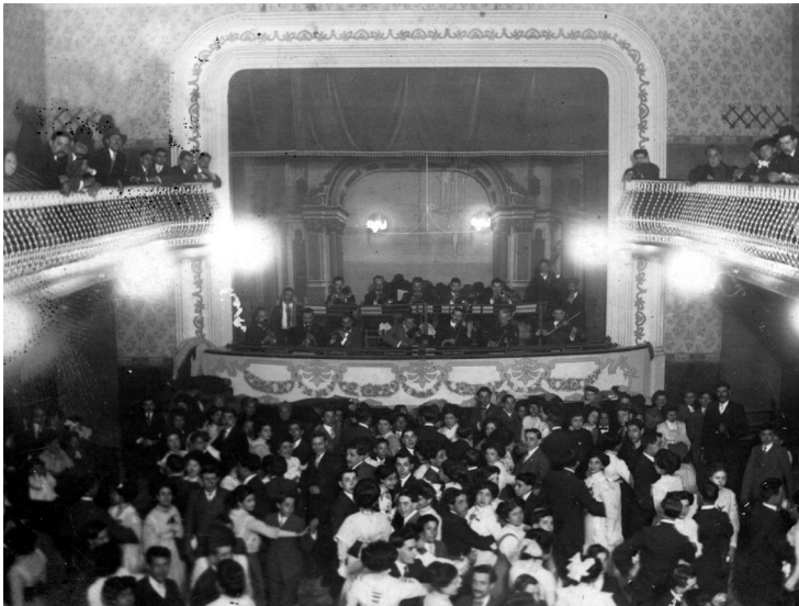
Ball a l'interior del teatre del Centre Catòlic, situat a la plaça de l'Església. Fotografia: Joan Guardia i Requesens, 1910, AMGr.

Ponències Revista del Centre d'Estudis de Granollers, 27 (2023), 7-43