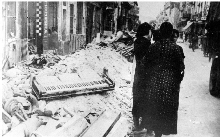
Bombardeig de Granollers. Vista del carrer de Josep Anselm Clavé des del carrer d'Agustí Vinyamata després del bombardeig. A primer terme, runes d'alguns dels edificis bombardejats i també restes d'un piano. Fotografia: Luis Torrents, 31/05/1938, AMGR.

Ponències Revista del Centre d'Estudis de Granollers, 27 (2023), 7-43