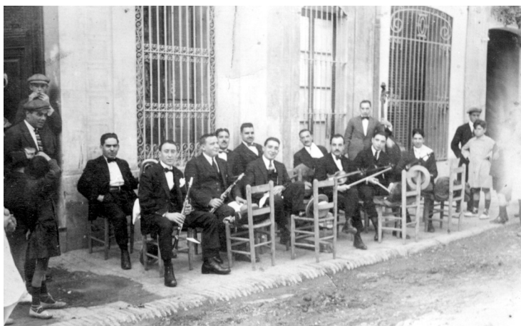
L'orquestra La Catalana durant les festes dels Sants Metges, al carrer de Joan Prim. Fotografia: autor desconegut, 30/09/1922, AMGr.

Ponències Revista del Centre d'Estudis de Granollers, 27 (2023), 7-43