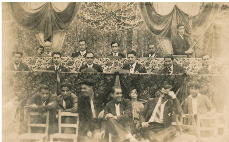
Músics d'una orquestra a l'interior d'un envelat.

els socis expulsats, i la nova directiva reflexiona sobre la deriva que estava prenent el Sindicat: «És de sobres conegut de tots que amb la rivalitat i els odis personals existents entre part dels que formaven la Directiva i els individus eliminats, hauria estat impossible arribar a una solució.» S'explica també que estaven revertint la situació econòmica: «estava atravesant una forta crisi. Una desconfiança dels socis, nascuda de la manera com procedia la Junta, feia que aquesta es veiés apurada per a fer complir a tothom en el que els correspongués pagar; i si a això hi ajuntem els gastos que reportaven els conflictes plantejats, resulta que ens trobarem amb un dèficit». 37 I també es canvia de local, deixen el de l'Orfeó Granollerí, i es traslladen al carrer de Sans, 29.