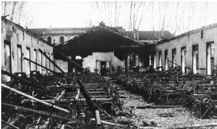
Fàbrica de Can Casas, incendiada per les tropes republicanes al seu pas per Llinars del Vallès.

Les unitats franquistes, per la seva part, van sortir de Mollet dividides en dues columnes i van iniciar l'encerclament de Granollers. La columna prin-