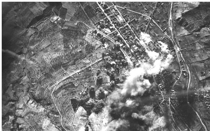
Bombardeig de l'aviació italiana sobre la Garriga el 29 de gener de 1939.

franquistes ocuparen la darrera localitat de la comarca, el municipi d'Aiguafreda. D'aquesta manera, al Vallès Oriental, la guerra acabava i s'iniciava una llarga postguerra.