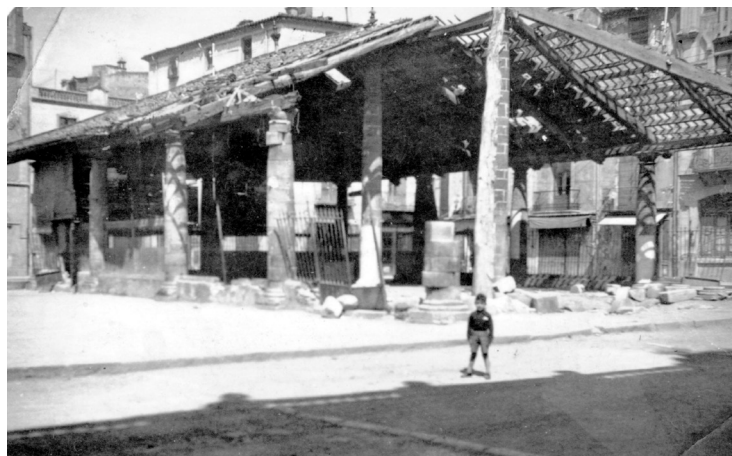
La Porxada de Granollers després del bombardeig del 31 de maig de 1938.

l'Aviació Legionària italiana va bombardejar sense pietat la ciutat de Granollers. Les forces aèries italianes tenien com a objectiu assolir l'equipament elèctric de l'empresa Estabanell i Pahissa, situat en part al carrer del Rec i en part entre els carrers del Rec, Jaume Balmes i Roger de Flor. La justificació de l'atac a la central elèctrica venia donada pel fet que transformava i subministrava energia a la línia del ferrocarril de Barcelona a Puigcerdà. 9 Tot i tenir perfectament marcats els objectius, els aviadors italians no encertaren a destruir-ne cap, i deixaren caure les bombes al bell mig de la ciutat. Com a resultat de les explosions els edificis afectats foren una vuitantena, mentre que les víctimes foren com a mínim 224 persones.