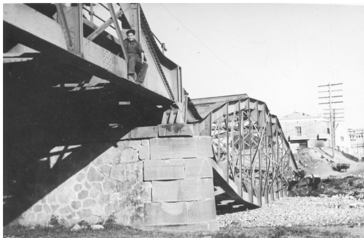
Estat del pont sobre el riu Congost, a Granollers, després dels bombardejos que va patir la ciutat el 24 i 25 de gener de 1939.