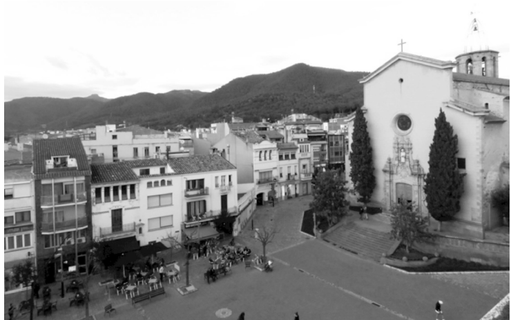
Capvespre de primavera a la Garriga, amb el Montseny de fons. Fotografia: Martí Oliveras, 5 abril 2016.

dels enquestats van respondre negativament i un 10 % no ho sabien o no contestaven.