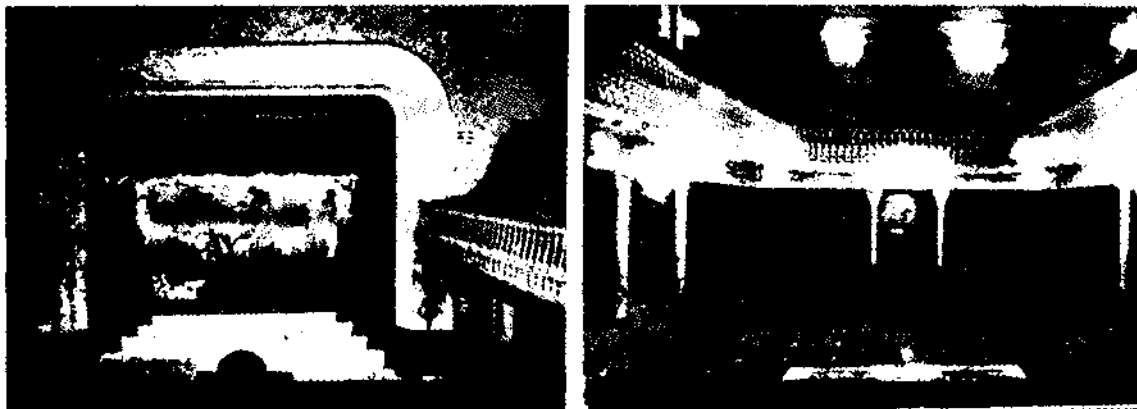
CENTRE CATÒLIC: L'escenar - La platea

esbarjo, es constata el d'“examinar els documents de l'arxiu en presència del secretari, si no hi ha prohibició de la Junta Directiva” (art. 43.3). Han d'aportar la quota mensual d'una pesseta. — Els Protectors : que paguen una pesseta mensual (art. 48). — Els Aspirants : amb una quota de 25 cèntims i tenen dret a participar en les activitats recreatives. Els estatuts del 1893 augmenten les quotes i els del 1915 canvien les denominacions dels socis.