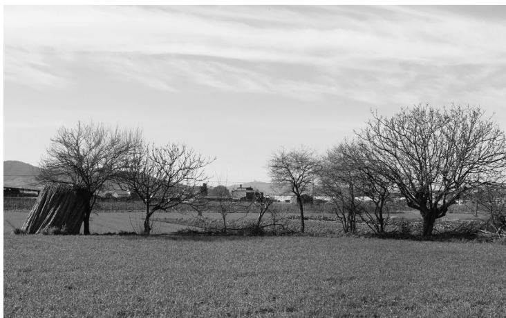
Paratge rural de Palou, l'espai rururbà de la Granollers agropolitana. Fotografia: Vicenç Planas, març 2013.

Ponències Revista del Centre d'Estudis de Granollers, 21 (2017), 89-120