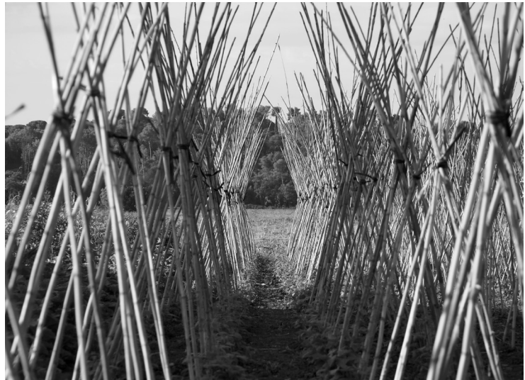
Conreu de varietats locals de mongeta a l'Ametlla del Vallès. Fotografia: Jordi Puig, agost 2014.

Per la seva banda, també s'ha publicat recentment la Guia documental dels productes del Vallès Oriental , editada per les biblioteques de Granollers, una síntesi dels principals productes agrícoles basada en la tradició mediterrània de la comarca, vinculada al cereal, l'oliva i la vinya. A més a més, s'identifiquen els productes agroalimentaris més característics, com són els llegums, l'horta i la fruita. En aquesta publicació es parla dels productes en general sense especificar cadascun dels productors, tal com es fa en el Catàleg de Productors Artesans del Vallès Oriental.