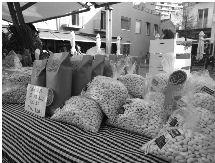
Productes de Palou en el mercat del dissabte de Granollers. Fotografia: Neus Monllor, gener 2017.

L'augment dels productes locals i ecològics és una mostra d'un canvi de tendència, tant des de la producció com des del consum. Nous perfils de pagesos i pageses agafen les regnes de les explotacions agràries i nous perfils de persones estan interessades a consumir aquest tipus de productes. El consum de proximitat és el ressorgiment i la revaloració de la producció agroalimentària vinculada a la terra i allunyada de l'homogeneïtzació productivista de l'agricultura convencional. Fruit d'aquesta emergència són els diversos projectes de recuperació de varietats i receptes tradicionals, així com productors i elaboradors centrats a fer un producte de qualitat.