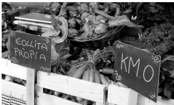
Detall del mercat del dissabte a la plaça de la Corona de Granollers, amb productors locals i ecològics de l'espai rural de la Granollers agropolitana. Fotografia: Neus Monllor, gener 2017.

Pel que fa al Pla Estratègic de Palou, el document descriu les principals línies de treball per tal de fomentar l'espai agrari granollerí, així com el consum d'aliments saludables a la ciutat. De les accions que s'hi recullen, algunes ja s'han portat a terme, com per exemple la creació de la marca de qualitat Productes de Palou, la participació en el projecte de banc de llavors locals o la creació del mercat de proximitat, i d'altres estan pendents d'execució, com ara la incubadora de projectes agraris, la facilitació de l'accés a la terra o el desenvolupament d'esdeveniments a Palou amb repercussions exteriors.