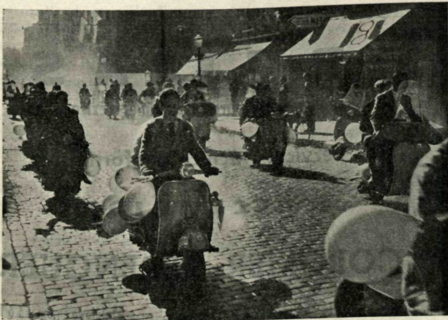
Con un concurrido desfile motorizado se iniciaron los actos de la IV Semana de Juventud

Como un final de etapa hay que considerar la conclusión de la Semana: un final de etapa que espera otras nuevas marchas, que exige el caminar hacia otras nuevas tomas de contacto con esta realidad apasionante del laborar cotidiano. Dispongámonos, pues, todos, a llevar nuestro esfuerzo a los nuevos esclarecimientos, a las nuevas realizaciones que, si la Semana ha dado su fruto, habrán de imponerse forzosamente.