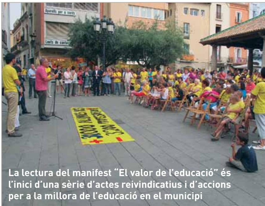
La lectura del manifest "El valor de l'educació" és l'inici d'una sèrie d'actes reivindicatius i d'accions per a la millora de l'educació en el municipi

Aquest curs han començat l'escola a Granollers 9.242 alumnes d'educació infantil, primària i secundària; 6.356, a infantil i primària i uns 2.860 a l'ESO.