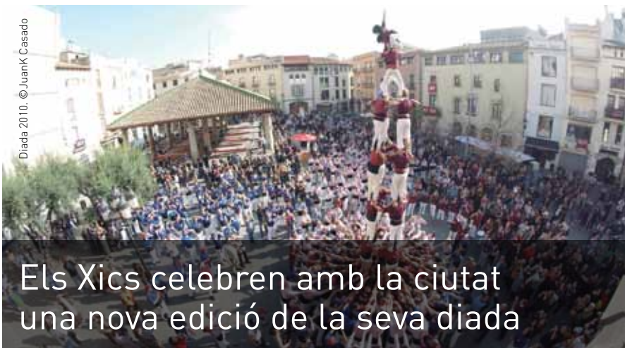
Diada 2010.