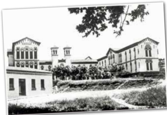
HOSPITAL DE GRANOLLERS, ANYS 30.

Ara fa 76 anys, en concret el 15 de novembre de 1936, neix el primer nadó a l'Hospital Asil de Granollers. La publicació La Gralla del 22 de novembre recull la notícia, indicant que es tracta