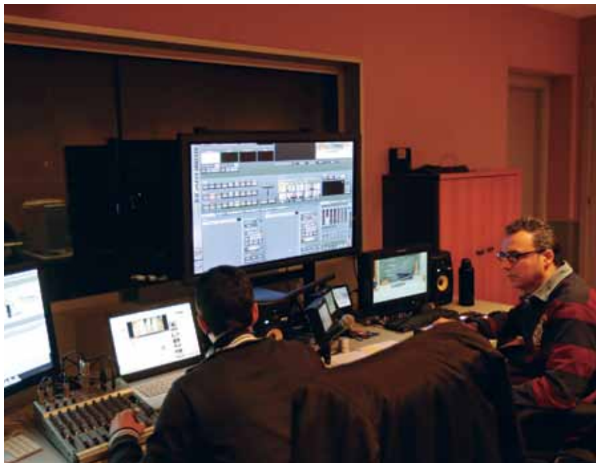
La sala de Post producció del Centre Audiovisual

El panorama audiovisual és canviant i la crisi econòmica agreuja la situació del sector. Les