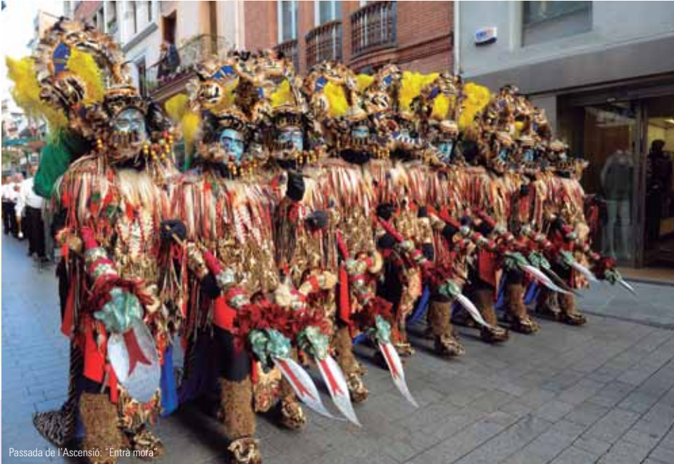
Passada de l'Ascensió: "Entrà mora"