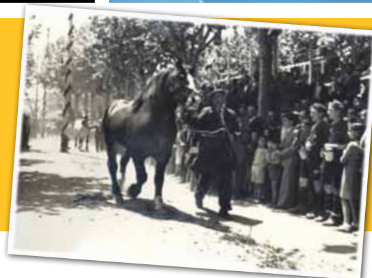
DESFILADA DE L'ASCENSIÓ AL PARC DE L'ESTACIÓ.