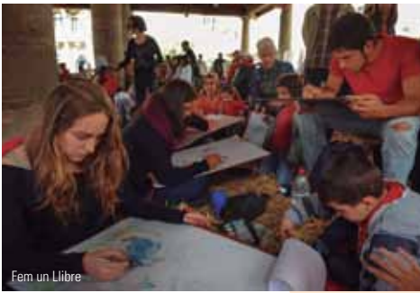
Fem un Llibre