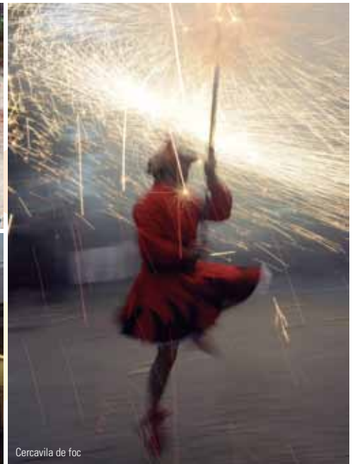
Cercavila de foc