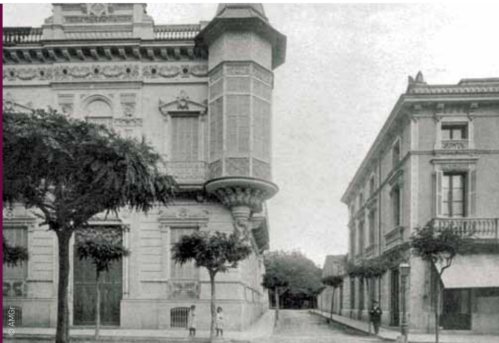
A dalt, Can Ramoneda, seu del Comitè de Defensa. A l'esquerra, can Ganduxer al carrer de Joan Prim, 44, seu del Sindicat d'Obrers de Doble Via

Granollers commemora enguany el 75è aniversari del bombardeig del 31 de maig de 1938. La Guerra Civil va trasbalsar la vida quotidiana de la gent per la sortida d'homes cap al front, l'arribada de població refugiada o l'escassetat d'aliments, entre d'altres fets. Els canvis revolucionaris del període van comportar transformacions profundes en la manera de governar la ciutat, en les relacions laborals, en les estructures de la propietat. Una de les conseqüències va ser la incautació de béns immobles privats que es van destinar a nous usos.