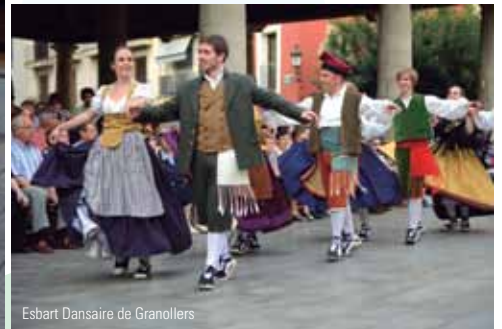
Esbart Dansaire de Granollers

Imatges de l'Ascensió 2012.