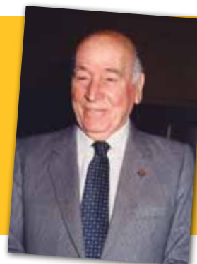
ANTONI JONCH EL DIA QUE VA PRONUNCIAR EL PREGÓ DE L'ASCENSIÓ, 1991.

Fa 21 anys que va morir el naturalista Antoni Jonch i Cuspinera. Zoòleg i farmacèutic granollerí nascut el 1916, va ser director del Museu de Granollers, càrrec que va deixar per dirigir el Parc Zoològic de Barcelona. Va fundar i dirigir el Centre d'Estudis de Granollers i va presidir l'Agrupació Excursionista. Va rebre la Creu de Sant Jordi el 1985 i va ser nomenat Fill Predilecte de Granollers, l'any 1994. La casa on vivia, al carrer del Rec, és des de 2008 la seu del Centre de Cultura per la Pau.