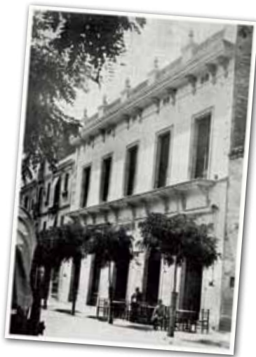
LA UNIÓ LIBERAL, 1895.

De l'abril de 1887 daten els estatuts de la Unió Liberal que, juntament amb el Centre Catòlic i el Casino van polaritzar la vida associativa de Granollers des de finals del segle XIX fins abans de la guerra. La Unió Liberal, que va néixer com una germandat que protegia els seus associats en cas de malaltia, va ampliar les seves seccions fins a cobrir diversos àmbits socials. El Centre Catòlic va sorgir com a contrapunt al Casino, associació de caràcter cultural i recreatiu. El Museu de Granollers es va construir en el solar de l'antiga Unió Liberal, local confiscat per Falange Española i després municipalitzat.