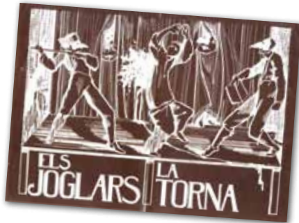
IMATGE DEL PROGRAMA DE MÀ DE LA REPRESENTACIÓ LA TORNA D'ELS JOGLARS, REPRESENTADA A GRANOLLERS ELS DIES 18 I 19 DE NOVEMBRE DE 1977.

El 18 i 19 de novembre de 1977 Els Joglars van actuar al Casino-Club de Ritme de Granollers amb la polèmica obra La Torna, dins del segon cicle de teatre de l'Associació Cultural de Granollers. L'espectacle, representat a 21 poblacions espanyoles, escenificava amb màscares el cas sòrdid de la detenció, judici i execució de Heinz Chez, el vagabund polonès executat pel govern de Franco, juntament amb l'anarquista Puig Antich. Amb aquesta obra satírica, Els Joglars van desencadenar l'ira de l'estament militar, motivant un consell de guerra contra els artistes que la van representar; algun dels quals van pagar-ho amb la presó i l'exili.