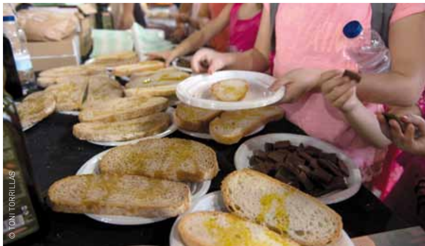
Seguir bons hàbits en l'alimentació, factor clau per tenir una bona salut

Granollers conjuntament amb altres sis ciutats d'Europa, formen part del projecte We Love Eating (WLE, "Ens agrada menjar"), que s'emmarca dins del programa Enjoying Being Healthy ("Gaudint de bona salut"), de foment i