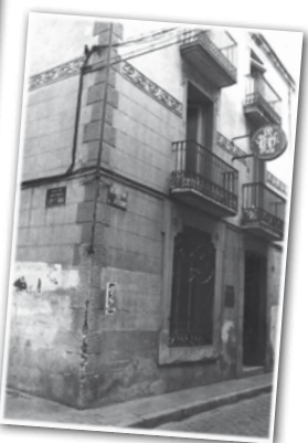
MÚTUA DEL CARME AL CARRER SANTA ELISABET.

Més de 50 anys d'història d'una entitat referent a Granollers, que al 1977 es va traslladar a l'actual edifici de la plaça Pau Casals. La Mútua és avui la única asseguradora del Vallès Oriental que disposa d'una clínica pròpia. Té unes instal·lacions de 7.500 metres quadrats i nou plantes amb consultoris per a especialitats mèdiques i quirúrgiques, laboratori, quiròfans, hospitalització, servei de radiodiagnòstic i servei d'urgències 24 hores, entre d'altres. Tot i que la seu es troba al centre de Granollers, La Mútua té diverses delegacions al Vallès Oriental, al Barcelonès, la Selva i el Maresme.