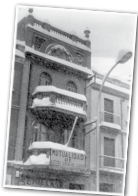
MÚTUA DEL CARME, 1962. AUTOR DESCONEGUT / AMGR

El 22 de febrer de 1965 va començar a funcionar la Mútua del Carme al carrer Santa Elisabet de Granollers, aviat farà 50 anys. La Mútua, però, ja des de l'any 1952 ofería els seus serveis en un pis del carrer Anselm Clavé, número 62.