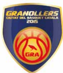
Aquest és el logotip que acompanyarà tots els actes que es faran aquest 2015

D'altra banda, en el marc d'aquesta commemoració, Granollers plantejarà la possibilitat d'acollir la final de la lliga catalana de bàsquet en les dates que marki la Federació Catalana de Bàsquet. El tradicional torneig de minibàsquet de Nadal, que aquest any es preveu que torni a comptar amb la participació d'equips europeus, i el relleu de Granollers com a ciutat del bàsquet català posarà fi a aquesta programació.