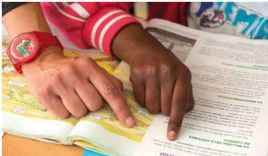
Infants i joves amb dificultats es podran acollir, gràcies al Pla de xoc, a diferents beques i rebre suport psicològic

El Consell Econòmic i Social de Granollers ha acordat les mesures del quart Pla de xoc per contribuir a pal·liar els efectes de la crisi. Aquest any 2015, el pressupost de l'Ajuntament incorpora una dotació inicial d'un milió d'euros que el Consell Econòmic i Social ha distribuït en diferents mesures i, per tant, ja es poden iniciar els tràmits administratius per aplicar-les el més ràpidament possible.