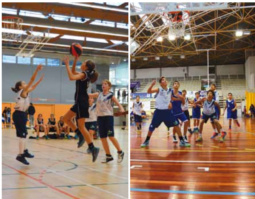
El tradicional torneig de Nadal de minibàsquet, un dels actes inclosos dins la programació de Granollers com a "Ciutat del Bàsquet Català 2015"

Entre les activitats previstes al març, el dia 8 hi haurà una concentració de jugadors i jugadores mini, més de 400 nois i noies d'entre 10 i 11 anys, que participaran en el programa de perfeccionament que gestiona la Federació Catalana de Basquetbol. També els dies 14 i 15 de març es farà un torneig de seleccions de categoria mini, amb jugadors i jugadores de Catalunya, València, Aragó i el sud de França. Aquest mes de març també s'inaugurarà l'exposició "100 anys de basquetbol a Catalunya. Del pati al parquet", un recorregut al voltant de l'evolució del bàsquet arreu del país, i que