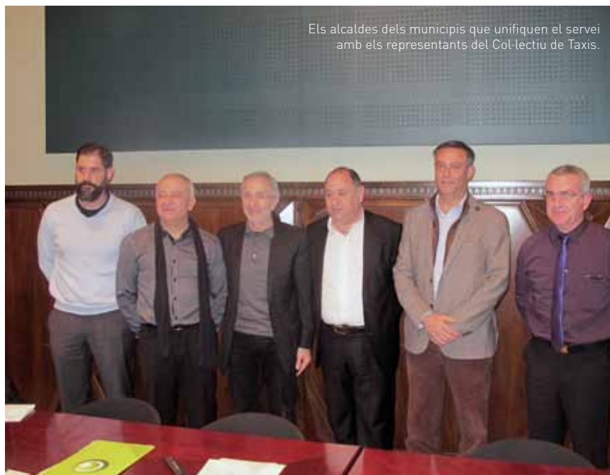
Els alcaldes dels municipis que unifiquen el servei amb els representants del Col·lectiu de Taxis.

Cada municipi mantindrà la competència per atorgar les llicències de taxi. En aquests moments, a Granollers n'hi ha 40; 7, a les Franqueses; 4, a Canovelles; i 1, a Lliçà d'Amunt.