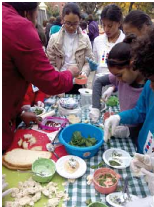
Un centenar d'alumnes de 3r a 6è de primària de l'escola Joan Solans van fer al novembre la Gimcana de la Dieta Mediterrània.