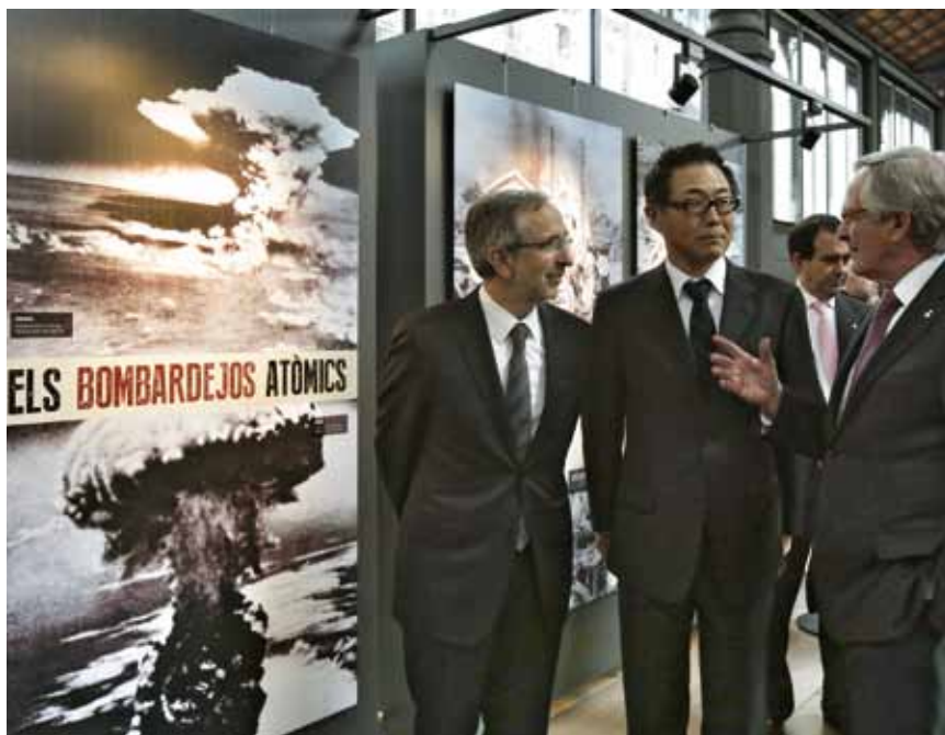
A sobre: Els alcaldes Mayoral i Trias, i l'ambaixador japonès, en la inauguració de l'exposició al Born Centre Cultural.

L'exposició "Hiroshima-Nagasaki. 70 anys de la bomba atòmica" es podrà veure al museu de