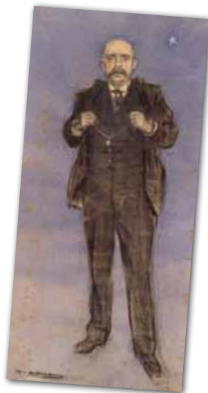
DIONIÓS PUIG I SOLER VIST PER RAMON CASAS (MNAC)

El 17 de febrer de 1910 va ser nomenat fill adoptiu de Granollers Dionís Puig i Soler, meteoròleg català de renom, considerat el primer meteoròleg professional de Catalunya pels seus pronòstics als diaris La Publicidad i La Veu de Catalunya a finals del segle XIX i principis del XX. Dinámica atmosférica y barografía de Europa (1913) i La sequía en España y sus causas: cambio de su régimen climatológico (1905) són dos dels seus treballs més coneguts. Puig i Soler, a banda de fer prediccions diàries, va inventar un mètode propi sobre meteorologia dinàmica per fer prediccions a partir de l'observació de mapes isobàrics. En la seva teoria va aplicar el principi pel qual el vapor d'aigua es concentra en les conques i augmenta la humitat. Tot i passar una vida dedicada a la recerca científica i guanyar nombrosos premis pels seus estudis, Puig i Soler va morir als 66 anys en un estat econòmic i de salut lamentable a la casa on va viure, a la plaça de la Corona de Granollers.