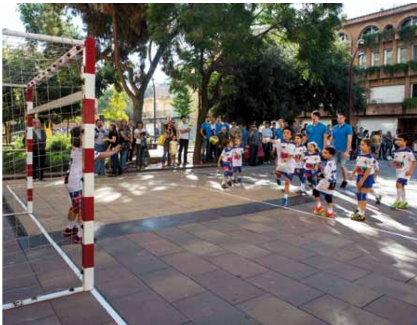
Nens i nenes jugant a handbol en la inauguració dels Jardins del BM Granollers, l'octubre passat.