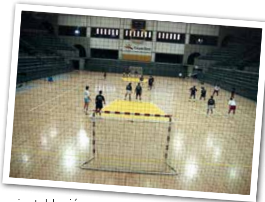
PRIMERS ENTRENAMENTS D'HANDBOL AL PALAU D'ESPORTS. AGOST DE 1991. AUTOR I FONTS PERE CORNELLAS / ARXIU MUNICIPAL DE GRANOLLERS

El 23 de juliol de 1991 es va celebrar al flamant Palau d'Esports de Granollers un Torneig Internacional d'Handbol que va servir per provar el funcionament d'aquesta nova instal·lació amb vista als Jocs Olímpics de Barcelona, que començaven un any després. L'equipament va ser dissenyat per l'arquitecte Pep Bonet i en la seva construcció hi van participar l'Ajuntament de Granollers, la Diputació de Barcelona, la Generalitat de Catalunya i el COOB '92. En el Palau d'Esports es van fer els partits d'handbol tan masculins com femenins de la primera i segona fase dels Jocs. En aquesta instal·lació hi entrena i juga actualment el Club Balonmano Granollers i el Club Esgrima Granollers.