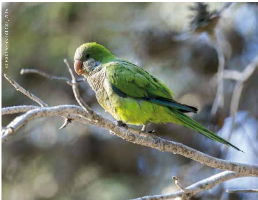
Exemplar de cotorra, una espècie de psitàcid o lloro que s'ha fet habitual a molts parcs i jardins. A sota: el niu d'aquests ocells pot arribar a pesar més de 100 k, amb el perill de seguretat que això pot suposar.

Els darrers anys, s'ha instal·lat al nostre país -i també a la nostra ciutat- la cotorreta de pit gris o cotorra argentina, una espècie invasora que ve del continent americà. Els experts parlen de "bioinvasió", perquè el nombre d'exemplars ha augmentat de manera desmesurada en llocs on no era habitual. El resultat: dany als ecosistemes, a la salut pública (pot causar pneumònies que es transmetin als humans i altres malalties) i a l'economia, a més de molèsties als ciutadans.