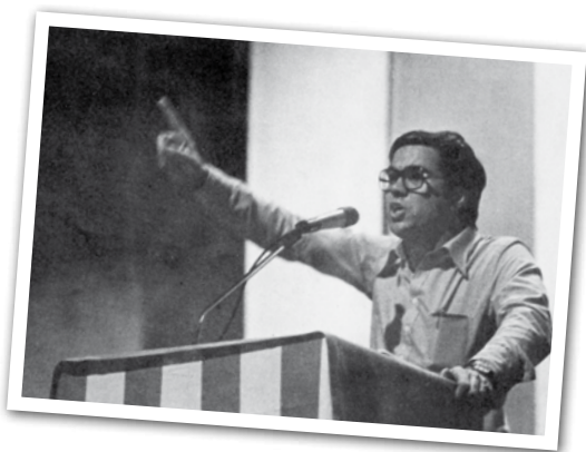
JOAN CAMPS EN UNA IMATGE DEL MÍTING DE LA DIADA DE 1976, EN QUÈ ES REIVINDICAVA EL RETORN DE LES INSTITUCIONS CATALANES DE L'ESTATUT DE 1932

Fa 40 anys es va fer a Granollers un míting convocat per l'Assemblea de Catalunya per commemorar l'11 de Setembre. No va ser un acte polític qualsevol. Era el 10 de setembre de 1976 i la premsa de l'època recull una assistència de 2.600 persones que van emplenar el Pavelló d'Esports per escoltar Joan Camps, que va morir prematurament el mes de novembre d'aquell mateix any, i Oriol Montaña, entre d'altres. Ambdós eren membres de l'Assemblea de Catalunya i demanaven amnistia per als presos polítics i exiliats; llibertats democràtiques; reivindicar el restabliment provisional dels principis i institucions de l'Estatut de 1932, com a via per arribar a l'autodeterminació; i coordinació de tots els pobles peninsulars cap a la democràcia.