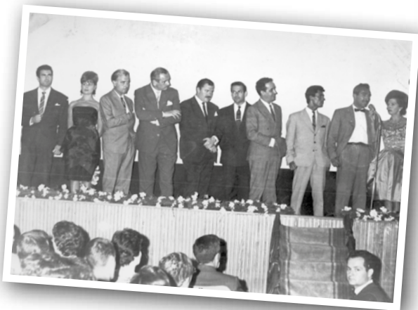
V SETMANA DEL CINEMA ESPANYOL AL CINEMA ASTÒRIA, 1961.

El 17 d'abril de 1960 es va inaugurar a Granollers el cine Astoria, amb capacitat per a 600 places. L'Astoria, que era al carrer d'Agustí Vinyamata, es va convertir en el millor cinema local i era també on el cineclub de l'AC portava a terme la projecció de pel·lícules i els debats posteriors a la dècada dels seixanta. En la sessió inaugural del cinema s'hi va estrenar Y después del cuplé , amb Marujita Díaz i Tony Leblanc com a protagonistes i Los implacables , amb Clark Gable i Jane Russell. Era l'època en què hi havia doble sessió de cinema i la gent hi anava molt sovint. L'Astoria també va ser un dels escenaris de la Semana del Cine Español que es va celebrar entre els anys 1957 i 1976. L'última sessió de l'Astoria va ser el 23 de maig de 1982.