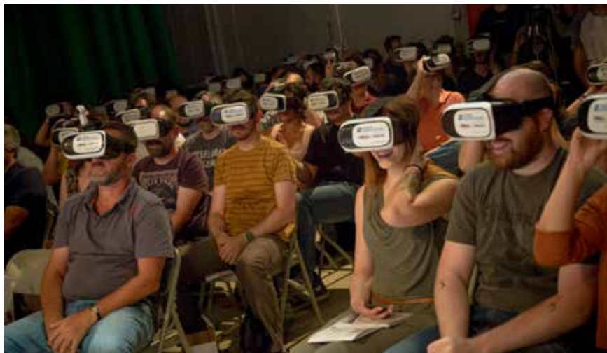
Una de les activitats del MAC 2017