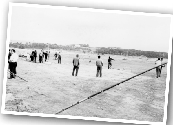
CAMPIONAT DE CATALUNYA DE LLANÇAMENT DE CANYA A PALOU, DURANT LA FIRA DE L'ASCENSIÓ DE 1971.