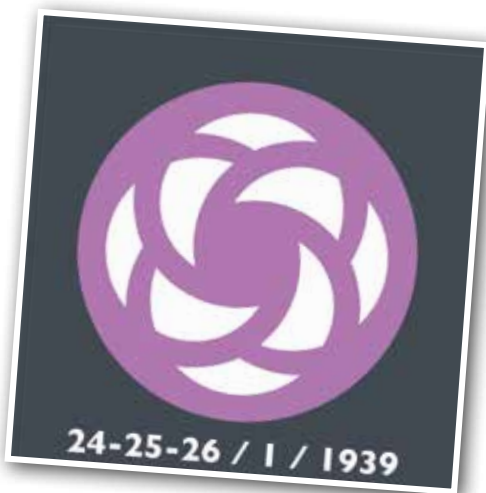
LES RAJOLES QUE MOSTRARAN ON VAN CAURE LES BOMBES ELS DIES 24, 25 I 26 DE GENER DE 1939 SERAN DE COLOR LILA PER DISTINGIR-LES DE LES DE 1938

A finals de gener de 1939 Granollers i altres municipis de la comarca com les Franqueses del Vallès, Mollet del Vallès, Cardedeu, la Garriga i Sant Celoni van patir atacs aeris, com a estratègia de suport a l'avanç de les tropes franquistes. A Granollers les bombes es van distribuir per tot el seu territori. Les conseqüències d'aquests atacs van provocar la xifra oficial de 36 morts, molts d'ells immigrants procedents de poblacions de la província d'Almeria, que eren a Granollers treballant en la construcció de la nova línia del ferrocarril. Coincidint amb el 80è. aniversari d'aquests bombardejos es senyalitzaran amb una rajola els espais afectats. Aquest acte es farà diumenge 3 de febrer, a les 12 h, i el punt de trobada serà la plaça de la Font Verda, per fer un petit recorregut pels volts del passeig de la Muntanya on van morir diverses persones.