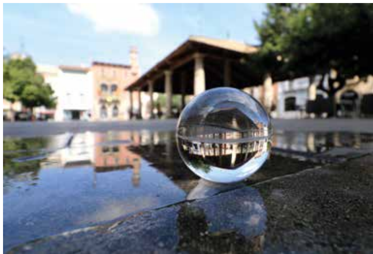
Dues de les imatges guanyadores de la darrera edició del Ral·li fetes per Jordi Vila (esquerra) i Pol Casero (dreta).