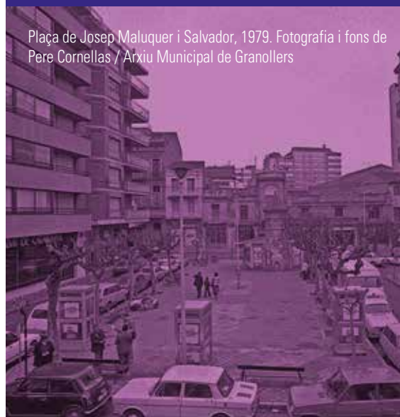
Plaça de Josep Maluquer i Salvador, 1979.

DEL 6 DE JUNY AL 2 D'AGOST DE 2019 AJUNTAMENT DE GRANOLLERS. PLAÇA DE LA PORXADA, 6